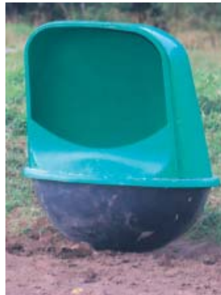
Slike automater kan brukes til tildeling av mineraler til storfe. Det finnes også en mindre utgave til småfe.

For sindyr, ungdyr og dyr som ellers får lite kraftfôr, og er i nærheten av setra, kan fri tilgang på Pluss Multitilskudd Appetitt fra automat være en løsning for å få tilskudd av nok mineraler. Dette er en enkel måte å tilføre mineraler på, når dyra ikke føres individuelt. Denne blandinga er sammensatt for at dyra skal ta en passende mengde når de får fri tilgang. Det er innholdet av salt som regulerer opptaket. Flere undersøkelser viser at dyra ofte regulerer opptaket av salt etter sitt eget behov. Pluss Multitilskudd Appetitt er tilsatt ekstra salt i en mengde som er avpasset de øvrige mineralene. Slik er det unødvendig og ikke ønskelig å gi saltslikkestein i tillegg. Ekstra magnesium er tilsatt for å forebygge graskrampe. Mikromineralinnholdet i denne blandinga er redusert i forhold til standard mineralblanding, for å hindre overdosering av for eksempel selen. Ved