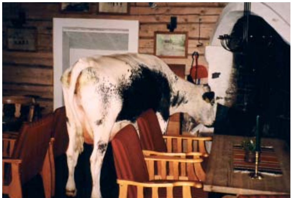
Gråkoll i peisestova på Jøldalshytta.

av vatn gjennom kjølenettet under tanken, og ein gassdrivi varmvastank. Så lenge vi måtte ha pumpe og varmvastank lell, var dette ei svært billeg løysning og bra nok når ein berre skal yste til eige bruk. Men tanken er veldig djup å arbeide i, og det er ganske avgrensa kva type ost ein kan lage. Oppvarminga går raskt og enkelt med mengder tilsvarande dagfersk mjølk frå 3-4 STN kyr, men eg trur ikkje det vil vera mogleg å t.d. pasteurisere med eit slikt opplegg. Vaskarvatn varmar vi på vedomn inne i seterstuggu.