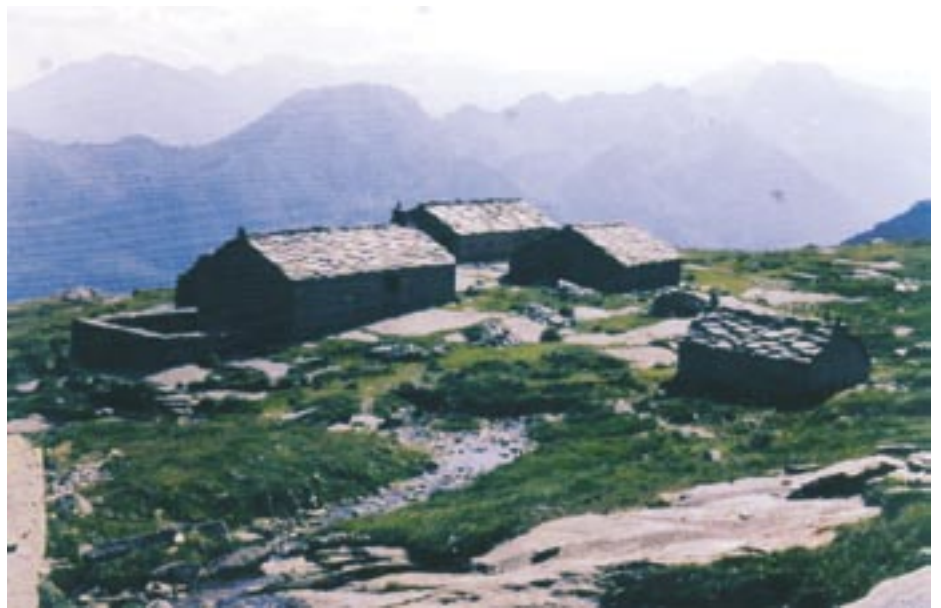
I seterområda er det svært mange gamle bygningar, dei fleste bygd i stein.