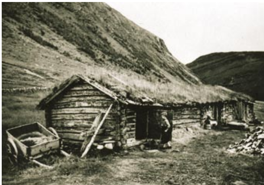
Det var her på Flyaseter'n det var "seterhusmann" lengst. Biletet er teke av Halvor Vreim i 1937 – og finst i Riksarkivet.

- Om nokon kjenner til liknande opplegg frå andre stader, med "husmenn" buande på setrene, så ville det vera interessant å få kjennskap til det.