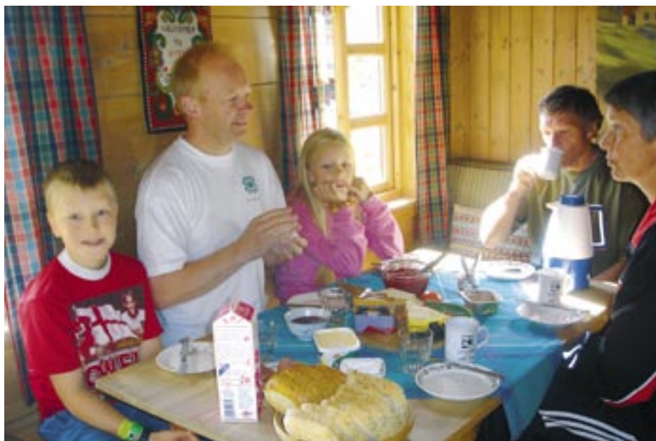
Godt med mat etter fjøsstellet.

Utan strauum og dermed ingen TV, og radio berre i fjøset under mjølkinga, vart det god tid til kortspel og andre aktivitetar. Der stakk også innom folk med ulike ærend,