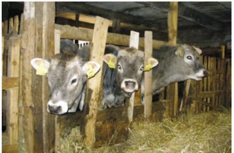
Trivelege kalvar!

statlege tiltak (som i Austerrike). Berre slik vil det vera mogleg å sikre vidare produksjon av høgkvalitetsprodukt på setrene i Nord-Italia. Den typiske karakteren til våre regionale produkt skriv seg frå den spesielle kvaliteten på setermjølka vår, som i sin tur heng nøye saman med floraen. Fjellbeitet frå Piemonte austover mot Friaul er særleg rikt på urter. På andre sida er vår alpine flora avhengig av næringsstoff som blir tilført jorda gjennom beitefe. Tradisjonell produksjonsteknikk, særleg lokale produksjonsmåtar, gjev kvalitet til seterprodukt våre.