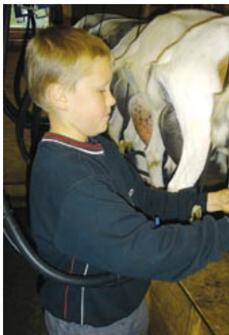
Konsentrasjon om mjølkinga.

Stor takk til vertskapet på Øvre Bell for at vi fekk sleppe til!