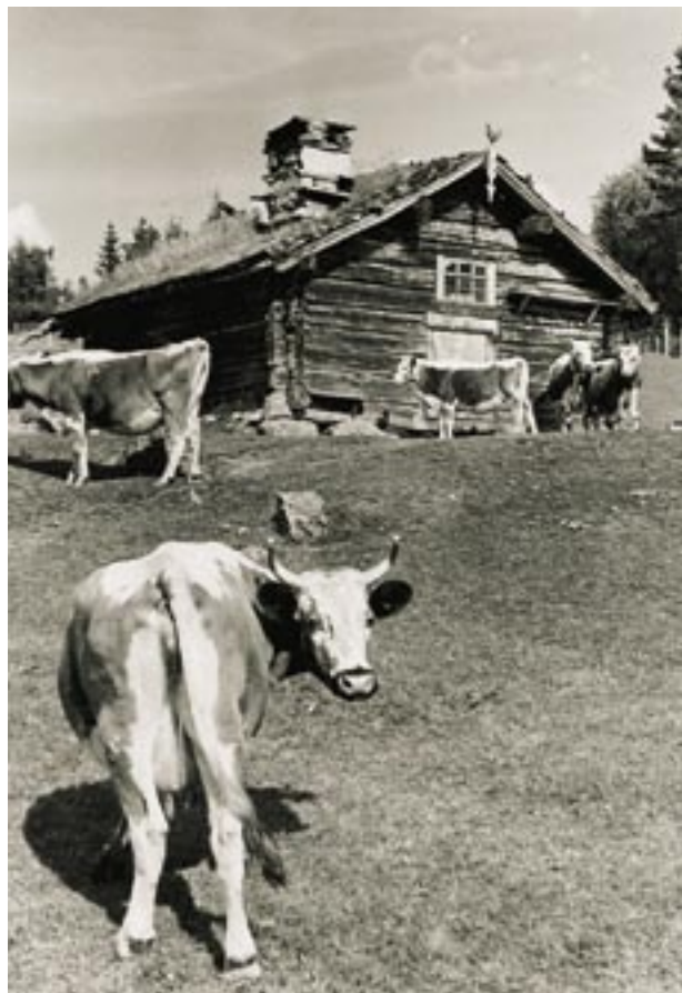
Telemark: "Rauland. Setusel, Sudistog Holtar." Foto: Halvor Vreim 1940.

Fra seterbruksundersøkelsen omfatter arkivet bl.a. en fotosamling. Store deler av landet er representert. De aller fleste bildene er tatt av arkitekt Halvor Vreim i slutten av 1930-åra og i begynnelsen av 1940-åra. Han var sakkkyndig medarbeider for byggeskikken, og bildene var bl.a. beregnet til illustrasjonsmateriale. Noen av bildene er gjengitt i Lars Reinton: Seterbruket i Norge b.1-III (1955-1961). Samlingen inneholder hovedsakelig eksteriørbilder av setergrender og de enkelte hus, men det er også noen interiørbilder og bilder som forteller om arbeidsoppgavene på setra.