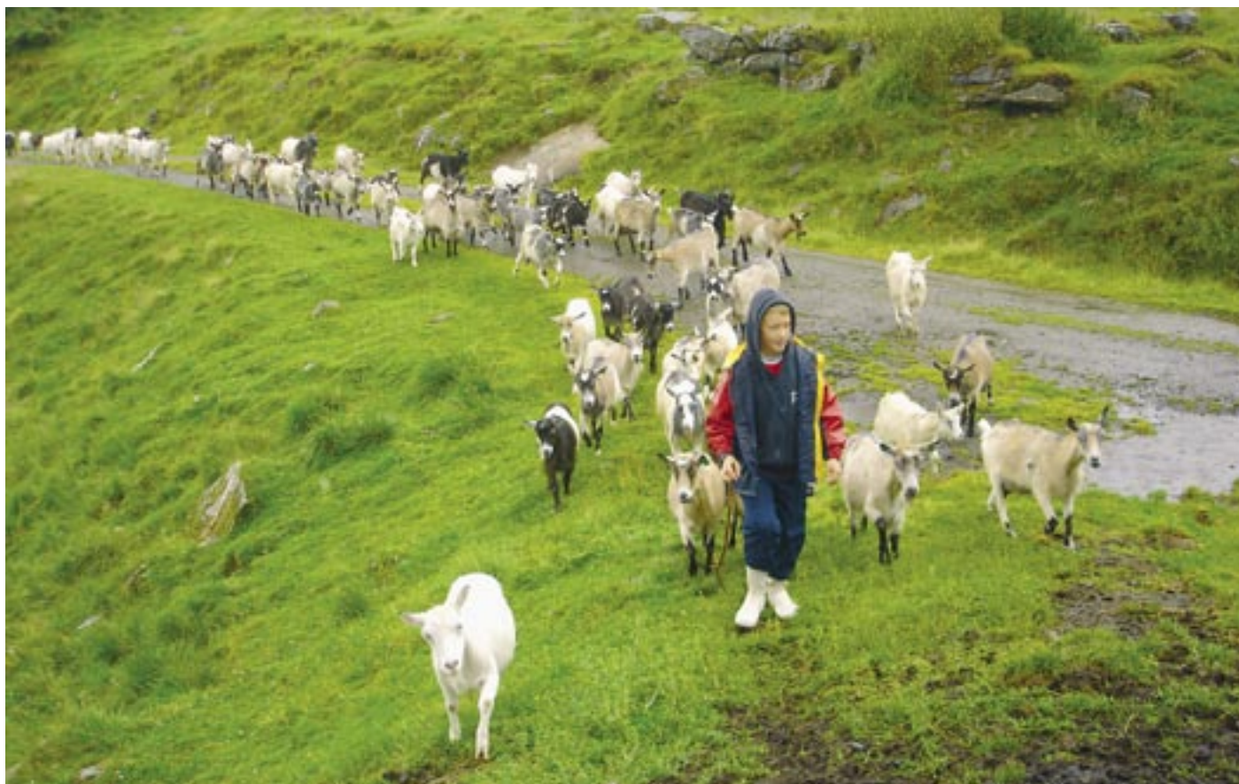
På veg ut på beite.

mjølkk vart henta og mjøl levert. Med Gaula som næraste nabo måtte vi prøve fisken som vi såg frå fjøsdøra. Eit pent knippe med aurar let seg freiste av marken som kom siglande i enden av snøra, og angra nok på det. Var det vær til det, så gjekk vi til fjells. Molte fann vi òg.