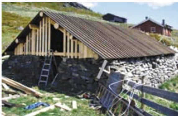
Arbeidet med fjøstaket på Strø i Vestre Slidre er fullført.