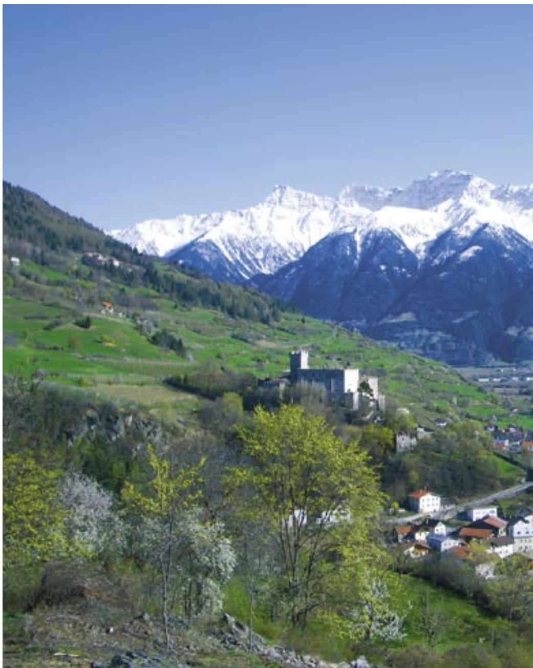
Flott utsikt og praktfulle fjell! Framleis betyr seterdrifta mykje i mange fjellbygder i Nord-Italia.

Spekulasjon frå store eigedomsselskap med storstilla utbygging av "Zweit-Häuser" (hus/heim nummer to) i fleire nord-italienske dalar tok til i 60-åra. Det utvikla seg ein villturisme, heilt utan omsyn til lokal kultur! Utviklinga har skapt fjell-landsbyar og -grender utan sjel og røter. Bustadeigedom - "Zweit-Häuser" - er og blir sovesalar om sommaren for tilreisande byfolk. Resten av året, særleg om vinteren - med mindre det er skiområde rett utanfor døra - vil hus stå folketome. Like fullt... seterbruket fyller uerstattelege oppgaver. Det gjeld ikkje berre innafør matproduksjon, men også for miljøet.