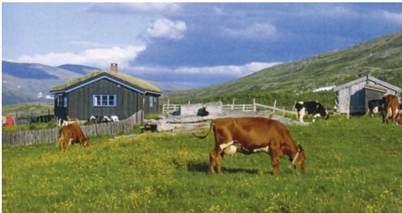
Stemningsbilde frå Kvita.

Sommaren 2005 var det 8 av seterbrukarane som dreiv tradisjonell setring med mjølkproduksjon i området, vidare beiter 9-10.000 sauer og lam og kring 1.000 storfe innafør Dalsida statsalmenning. Det er registrert over 330 bygningar knytt til setermiljøa, der i allefall 250 har klar samanheng med seterdrifta. Minst 100 av desse bygningane er bygde før 1900. Alt dette viser kva ressursar Dalsida har knytt til den tradisjonelle bruken av området, og som avgjort er eit godt grunnlag for ytterlegare verdiskaping. – Forprosjektet inneheld m.a. eit eksempel på eit reiselivskonsept for ei av setergrendene, med særleg fokus på tilbod for barnefamiljar. Det er vidare peika på ei rekkje element som kan inngå i utvikling av seterprodukt av alle slag. Vi merkar oss at Oppland fylkeskommune vil "bidra aktivt i utviklingen av regionenes grønne fortrinn" – m.a. ved utarbeiding av byggjeskikkettleiar, gjennomføring av seterseminar, stille til rådvelde ekspertise på ei rekkje område, hjelpe til med søknader til sentrale kulturminneaktørar og tilrettelegging for finansiering av tiltak. Dalsida er eit område som avgjort har store mulegheiter for ytterlegare verdiskaping med utgangspunkt i seterdrift og seterkultur, og vi vil kome attende til kva som skjer i området. Deltakelsen på dei to seterseminara fortel i allefall om stor interesse for temaet.