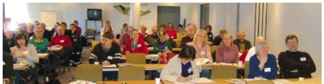
Ei lydør forsamling

gamle og unge som kom innom for å henta frå ei eng i nærleiken vart det så