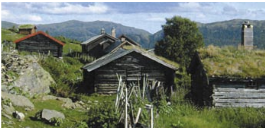
Frå Sjong, Dalsida på Lesja.

Gardsdrifta må sjåast i eit større perspektiv. Driftsmåten kan variere frå generasjon til generasjon, og vedlikehald av stølsbygningane, som andre driftsbygningar på garden, er viktig for landet vårt. I artikkelen i tidskriftet SKATTERETT (nr. 2 1988) vert det samanfatta slik: "Dersom stølshusa vert nytta i samband med næringsverksemd på garden har gardbrukaren rett til å utgiftsføre vedlikehald og skrive av påkostningar på selet og dei andre bygningane på stølen. Det er ikkje noko krav at det skal vera mjølkeproduksjon på stølen. Det gjeld like fullt ved