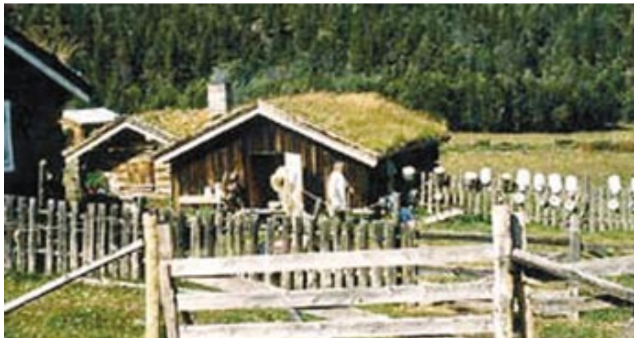
Brenden seter i Lesja, eit godt eksempel på korleis tradisjonell seterdrift og turisme kan utviklast.

En ting som er oppmuntrende, er at det faktisk er 4 kommuner som har en oppgang på til sammen 5 setrer i drift. Det viser at det kan være mulig å stimulere til rekruttering, og det er selvfølgelig avgjørende for seterdriften på litt lengre sikt. Ellers er det vel å si at effekten av økte tilskudd må sees