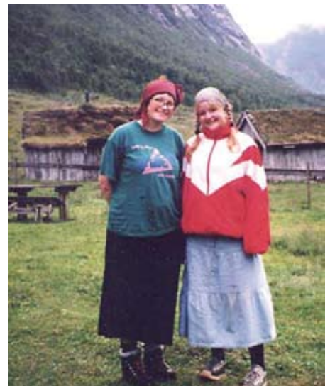
Fornøgdde "spatakistar" på setra.

Alle deltakarar (både på seter, gard og beitelag) skal vere utplasserte i minimum 10 dagar. Nokre er med i lengre periodar