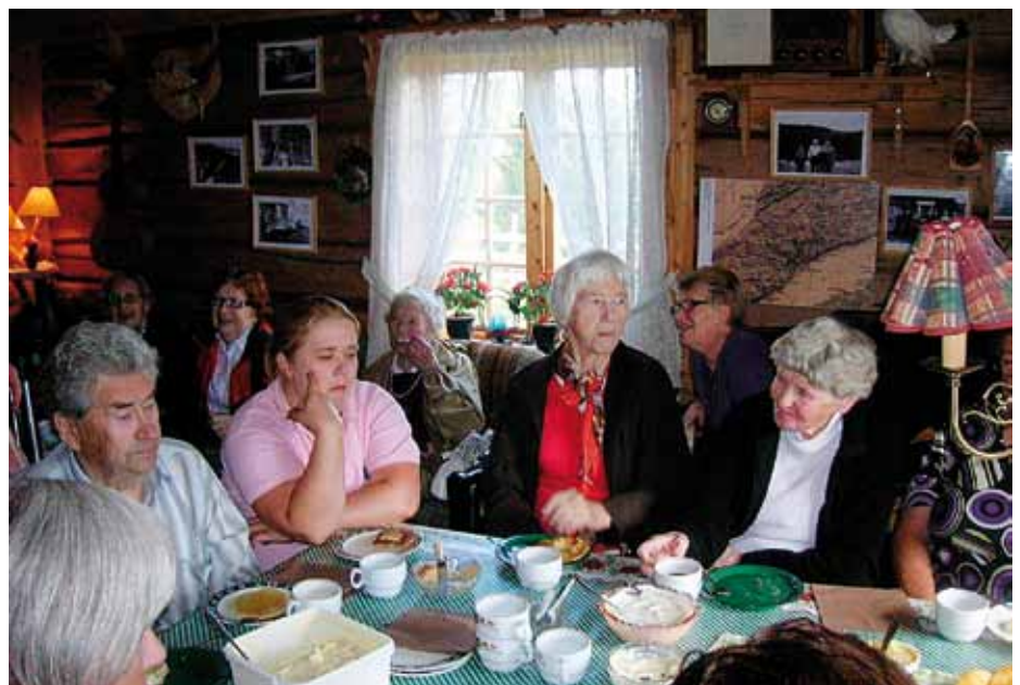
Helselagets medlemmer på besøk

Det er også mulig å gå inn på www.seterbygda.no for å lese om alle besøkssetrene i Leksvik kommune.