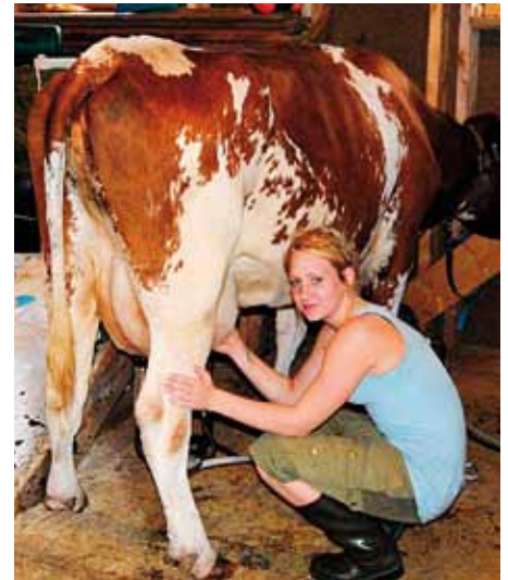
Malin budeie melker

Denne sommeren ble det arrangert kulturdag med fortellinger fra en gammel meieribestyrelse og musikk og sang av ett lokalt danseband på programmet. Det ble servert rømmegrøt, kokt fra bunnen av som var tykk og fet. Kaffe med vafler og sveler med hjemmelaget rømme fikk de også kjøpe. Det var ca 200 stk som kom i løpet av dagen så denne dagen var det fullt liv på setertunet. Det ble lovet å arrangere en lignende dag neste sommer også.