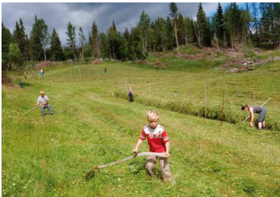
Urterikt høy fra slåtteeenga gir næringsrikt og godt for til geitene om vinteren.

Nørrestogo er et lite småbruk med 50 daa innmark hvor utmarksressursene er en viktig del av ressursgrunnlaget. De startet med oppal av kje for skinn og kjøttproduksjon de første årene, men så raskt muligheten for å lage ost av geitemelk på stølen. Kathrin hadde laget ost til eget bruk i flere år tidligere og bestemte seg for å ta modulkurset i melkeforedling på Sogn jord og Hagebruksskole for lære mer om ysting og se muligheter for