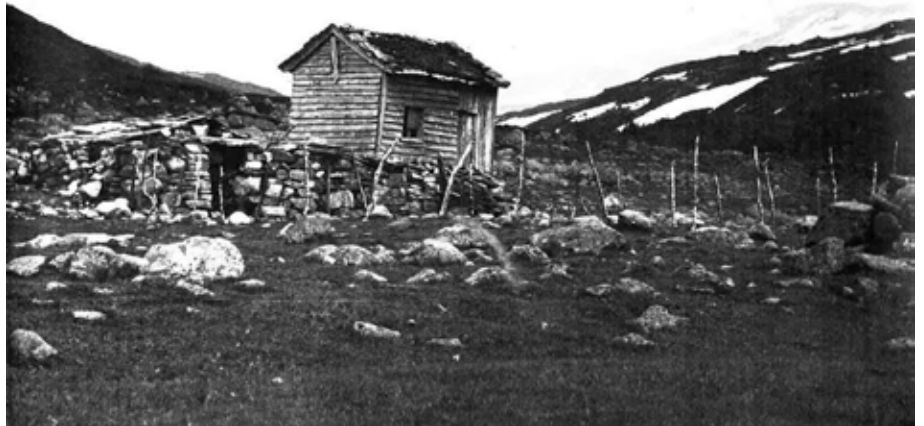
Dei gamle stølshusa i Middalen. Her støla me mesteparten av sommaren 1940.

Me hadde ikkje geitene på gjerde, me gjekk berre rundt på vollen og mjølka