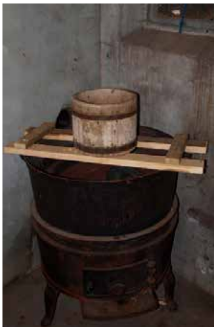
Ostekolle på tjuka.

mager og ikkje brukande til mat. Det var brukt til hundar og stølsgrisen. Når så mysa var komen godt på kok, vart fløyten tilsett. Då var det å fyra godt og hardt, så osten vart nedkoka så snart som råd, di snarare nedkoka di betre ost.