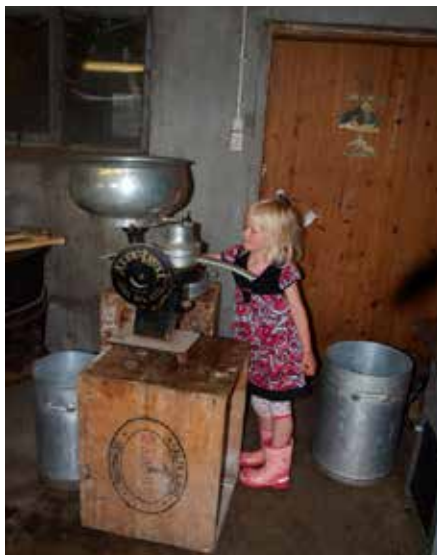
Separatoren var ein viktig del i arbeidet.

Når osten etter nokre timar var nedkoka, skulle han over i former. Men for at osten skulle bli slett og fin, måtte primen rørast kald. Dette var eit langvarig arbeid. Men for snau 100 år sidan kom primrørarane i bruk. Dei var å få kjøpa med motordrift. Men nevenyttige bønder og handverkarar tok til å laga rørarane sjølv, og nytta vasskraft til å driva dei.