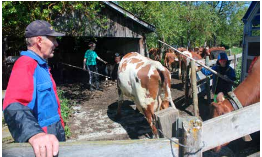
Flere generasjoner med på seterflytting på setra i Vingelen.

Hva er egentlig «immateriell kulturarv»? Det kan også kalles «levende kulturarv», som er et mer forståelig begrep. Det er snakk om levende tradisjoner og tradisjonell kunnskap som blir overført mellom folk, og gjerne fra generasjon til generasjon. Det er kunnskap som blir praktisert i dag og ført videre gjennom kreative uttrykksmåter, som håndverk, musikk, dans, mattradisjoner, ritualer og muntlige fortellinger. Denne levende kulturarven er avhengig av aktiv seterdrift og møter mellom folk for å bli ført videre.