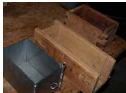
Osteformer. Fire kg var vanleg. Forma i midten var slik at det vart ein høveleg to-kilos ost ved å skjera av på midten.