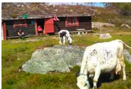
Setra på Torbuvollen.

Det er to bustadhus på garden, av til saman 18 bygningar, medrekna