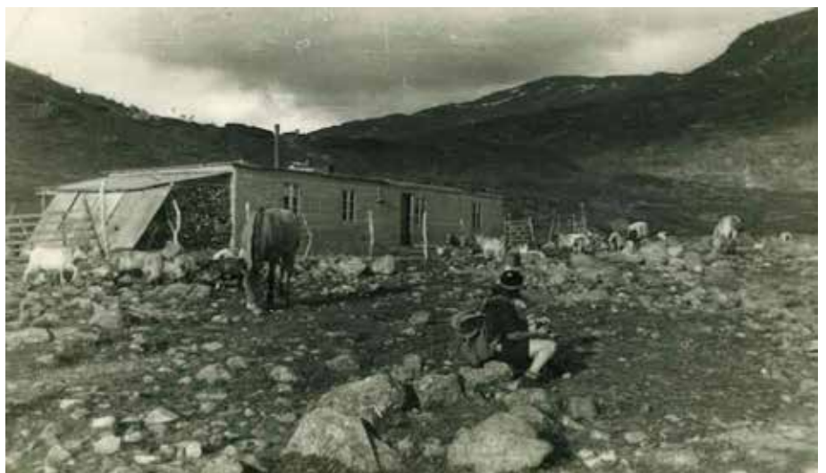
Fin sommarkveld ved stølshuset i Middalen.