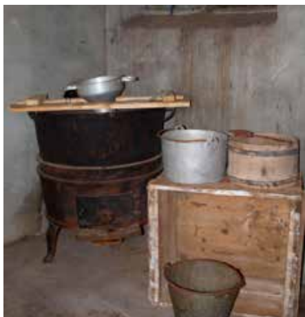
Mjølka vart sila i gryta.