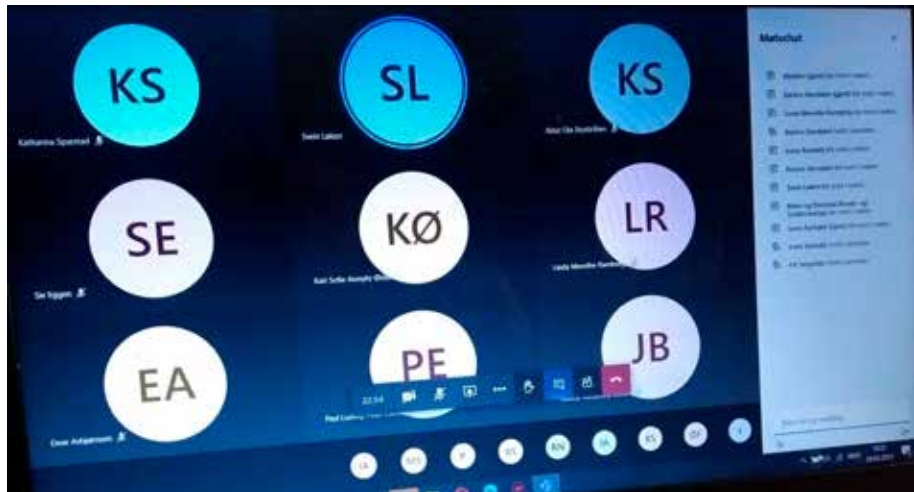
Årsmøtestaden var i år på skjerm..

Norsk seterkultur har arbeidd for at seterkulturen skal koma inn på Unesco si liste for immateriell kulturarv. Årsmøtet på Lillehammer i 2020 vedtok å ikkje gå vidare med