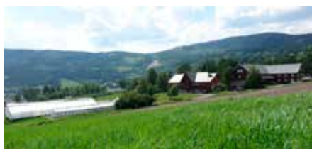
Løken gard i Øystre Slidre.

Løken har vore forsøkgard sidan 1918, men forsøkgarden vart avvikla