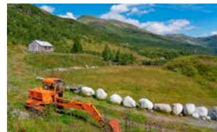
Frå Olavstøl i Granvin.

havet, i retning Mjølfjell og Finse frå Granvin. Er du interessert i beite kan du ringja 90705810.