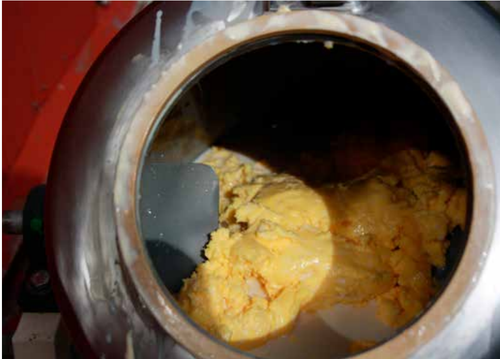
Kinning av setersmør.

Norsk seterkultur oppnådde høsten 2019 «beskytta betegnelse» for setersmør på tradisjonelt grunnlag. Sommeren 2020 vil bli et testår for ordningen.