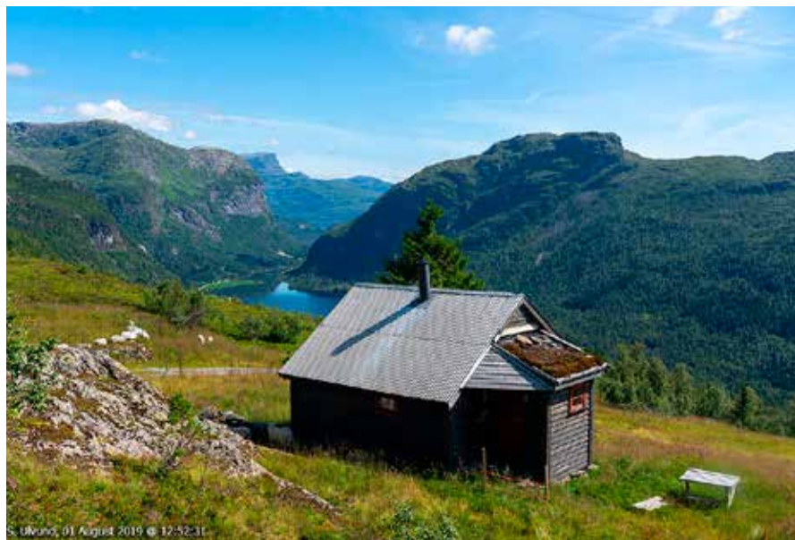
Frå stølsgrenda Olavstøl i Granvin i Hardanger er utsynet vidt.