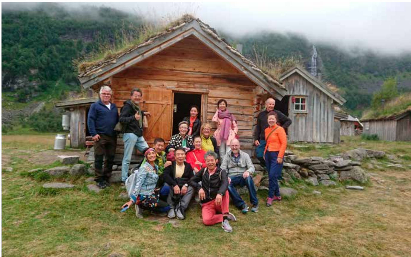
Her er svenske og kinesiske gjester på Herdalssetra i 2019.