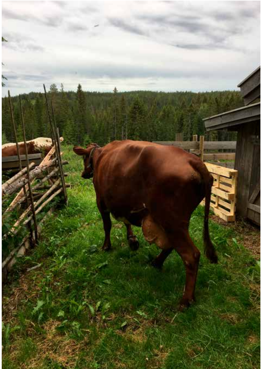
Ei ku på veg ut på vangen på Skålbergsetra.

Det elektroniske skjemaet inneholder disse spørsmålene: