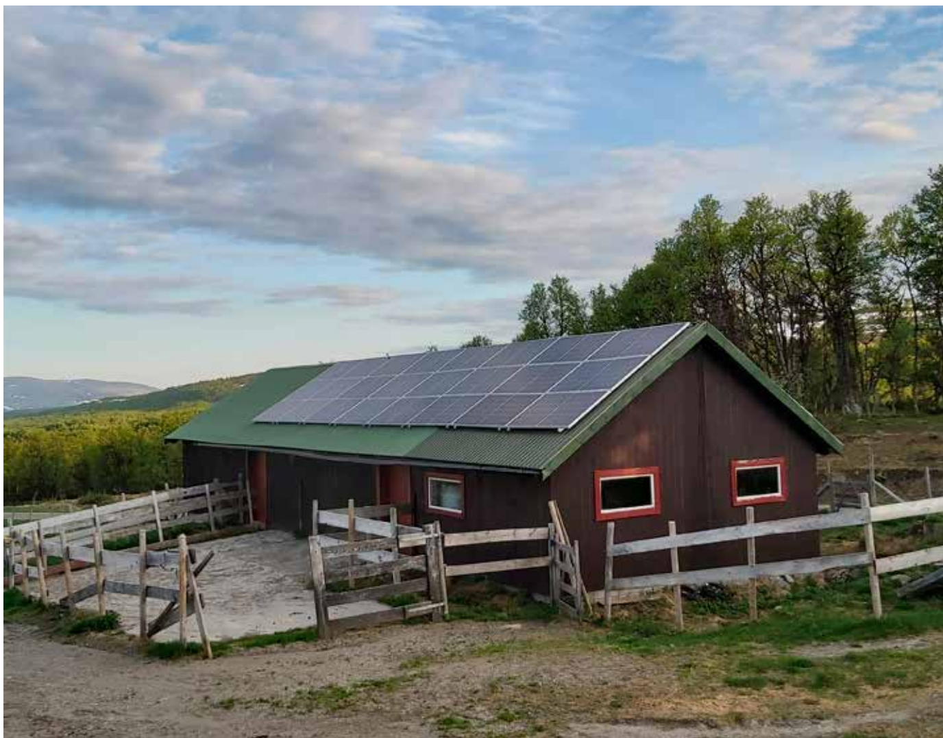
Solcellepanela kom på plass på setertaket alt i oktober 2019.

Sommarsola kan duga til meir enn å få graset til å veksa på setervollen. Med det rette utstyret kan sola driva både mjølkemaskin og tank.