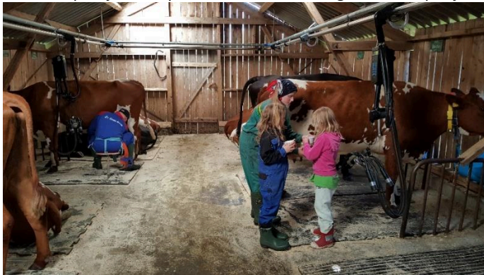
Vingelssetra i Nord-Østerdal.

UNESCO-prosjektet, spørreundersøkelsen og insta-kampanjen er i regi av organisasjonen Norsk Seterkultur.