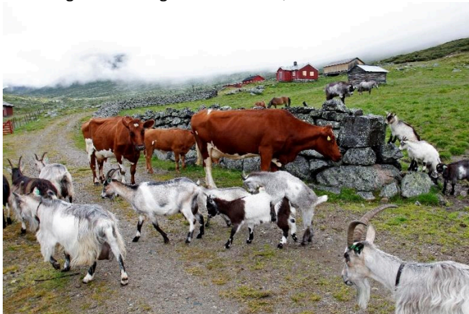
Sparstadstølen i Valdres.