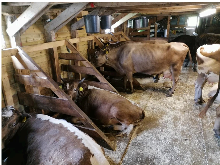
Figur 2. Fra Markesetstølen

Styremedlem Ove Søresand var på to seterbesøk der han tok bilder og dokumenterte i artikkel fra Gjengedalstølen og Markesetstølen