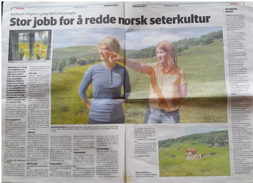
Figur 1.

Videre ble det det sendt ut pressemelding i forbindelse med tilsagn på 2,3 millioner til ungdom og setring som ble fanget opp av avisa Valdres og valdres.no: