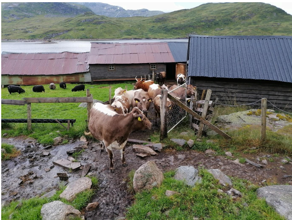
Frå Markesetstølen.