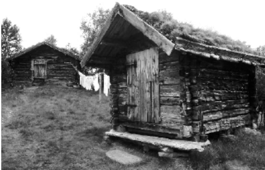
Ljøsnåvollen i Røros kommune, kor det også blir setra på vinterstid.