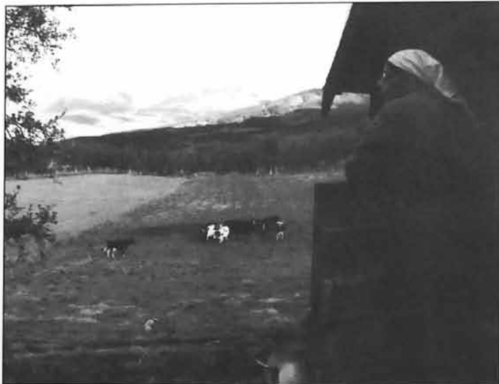
På Sessakersetra i Oppdal.

Hele året gleder jeg meg til seterperioden, og drømmen er å bli veldig tidlig for tidspensjonert slik at jeg kan være der hele sommeren, fra hvitveis og mye snø på Hornet til røsslyng og høststormene i september. Ingen av oss tre har anledning til å være budeie en hel sommer i