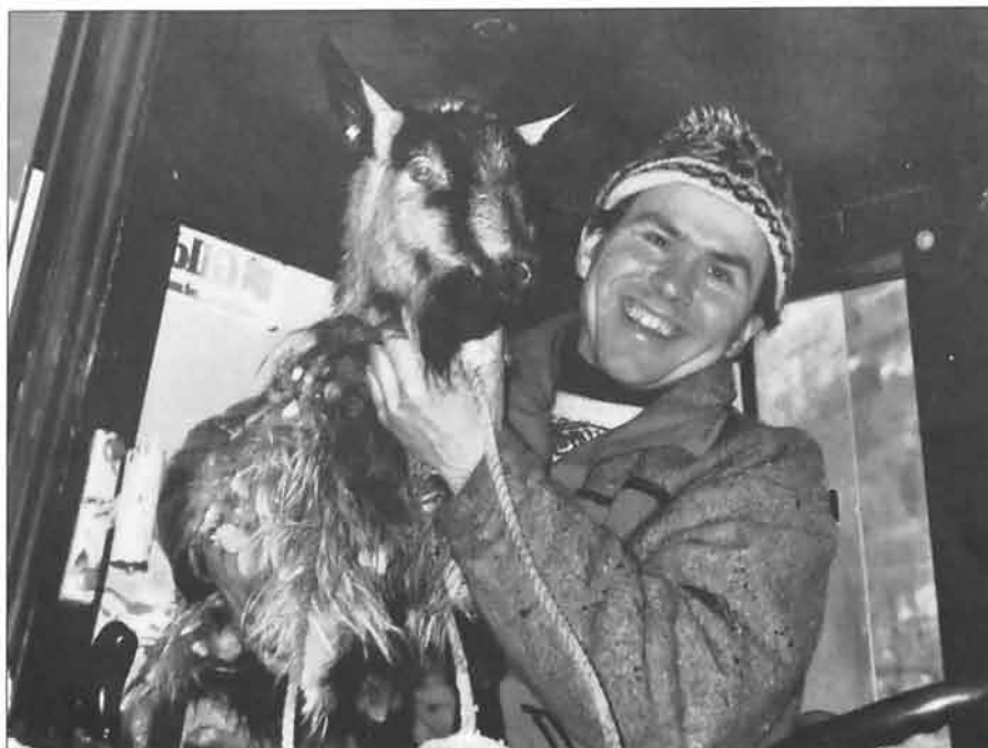
Heimatt med julegåve.

til seters ein slik kveld, det skymmer, heime ventar fjøs og .....Tungt å gje opp, men eg må ta nedover før det blir mørkt. Kallar medan eg baskar meg ned gjennom ur og skogsnar, ho svarar nokre gonger, eg ser ho står på same hylla, bit ivrig i grastustane, men vinden og snøvéret døyver meir og meir lyden. Kallar og lyer medan eg glir stilt på skia heimover vegen langs