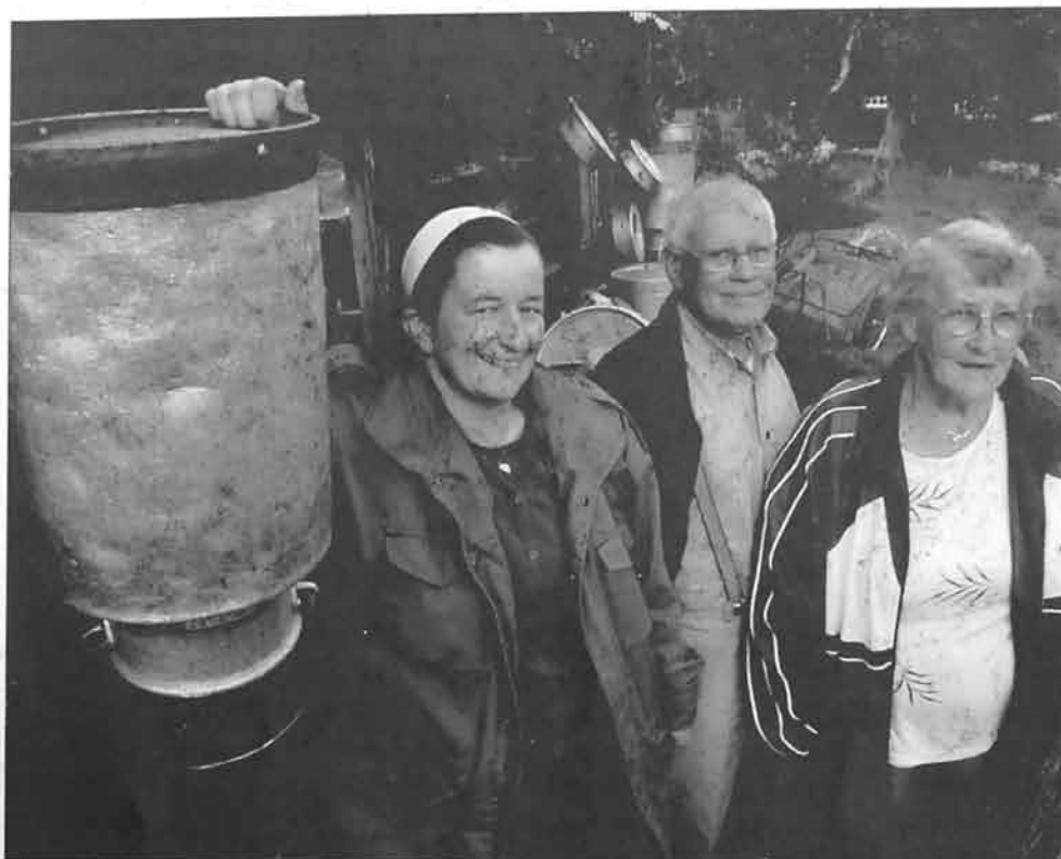
Gamle og nye drivarar på Kabbesetra.

Øvst i Romsdalen, heilt på grensa mot Lesja, ligg Brøstedalen. Ein frodig fjelldal med mange setervollar, ca. 600 m.o.h. I dag er berre Sæterbøstølen på Kabben i drift. Dalen ber umisskjenneleg preg av attgroing. Omkring Kabben opnar det seg - her det har vore uavbrote beiting av både sau og krøter.