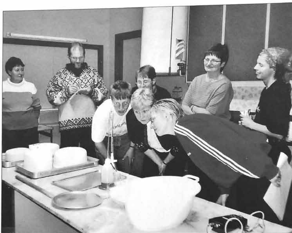
Vi skjønte fort at gamlemåten ikkje dugde når ein skulle yste moderne tankmjølk i eit samfunnsbus.

Setring og småskalamatproduksjon er i vinden. Gamle tradisjonar kjem til heider og verdigheit att, og brukarane sjølv ser optimistisk på framtida. Men nye tider stiller nye krav, den som skal produsere mat for sal i dag, må forhalde seg til reglar og forskrifter. For å få nok kunnskap til dette vart det arrangert ystekurs i Singsås.