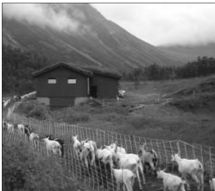
Geitene og kjea på veg inn til mjølking.