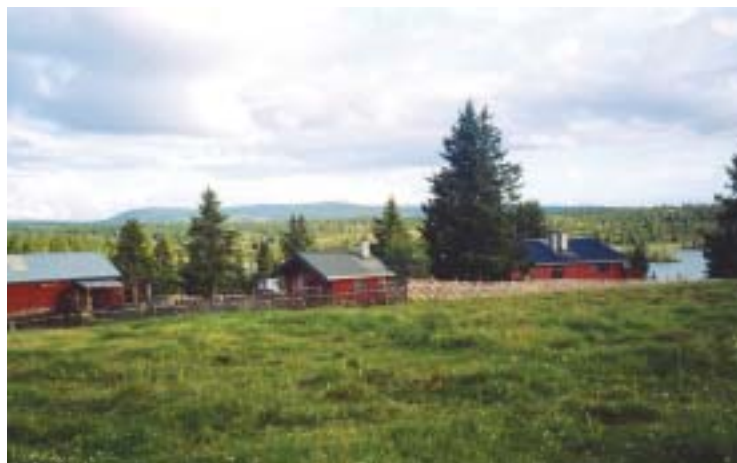
Frå setra Lien i Øystre Slidre.