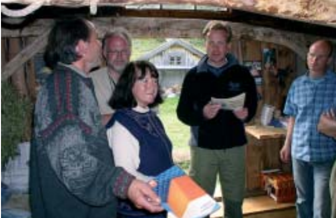
– og sjølvstogt vart det slått eit slag for både lokale mjølkeprodukt og Tine sine ostar.

for den norske fjellheimen sine mangfaldige verdiar. Med si sterke tilknytning til seterdalar i Oppdal, er det grunn til håp om at han også vil vera lydhør for argumenta for å styrke seterdrifta. NSK vil intensivere arbeidet for å få miljøstyresmaktene sterkare inn i arbeidet for seterdrifta. Stikkord er kulturlandskap, friluftsliv og biologisk mangfald, verdiar som ei aktiv og omfattande stølsdrift er sikraste garantisten for.