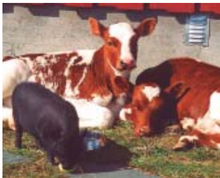
Kalv og minigris nyter seterlivet.