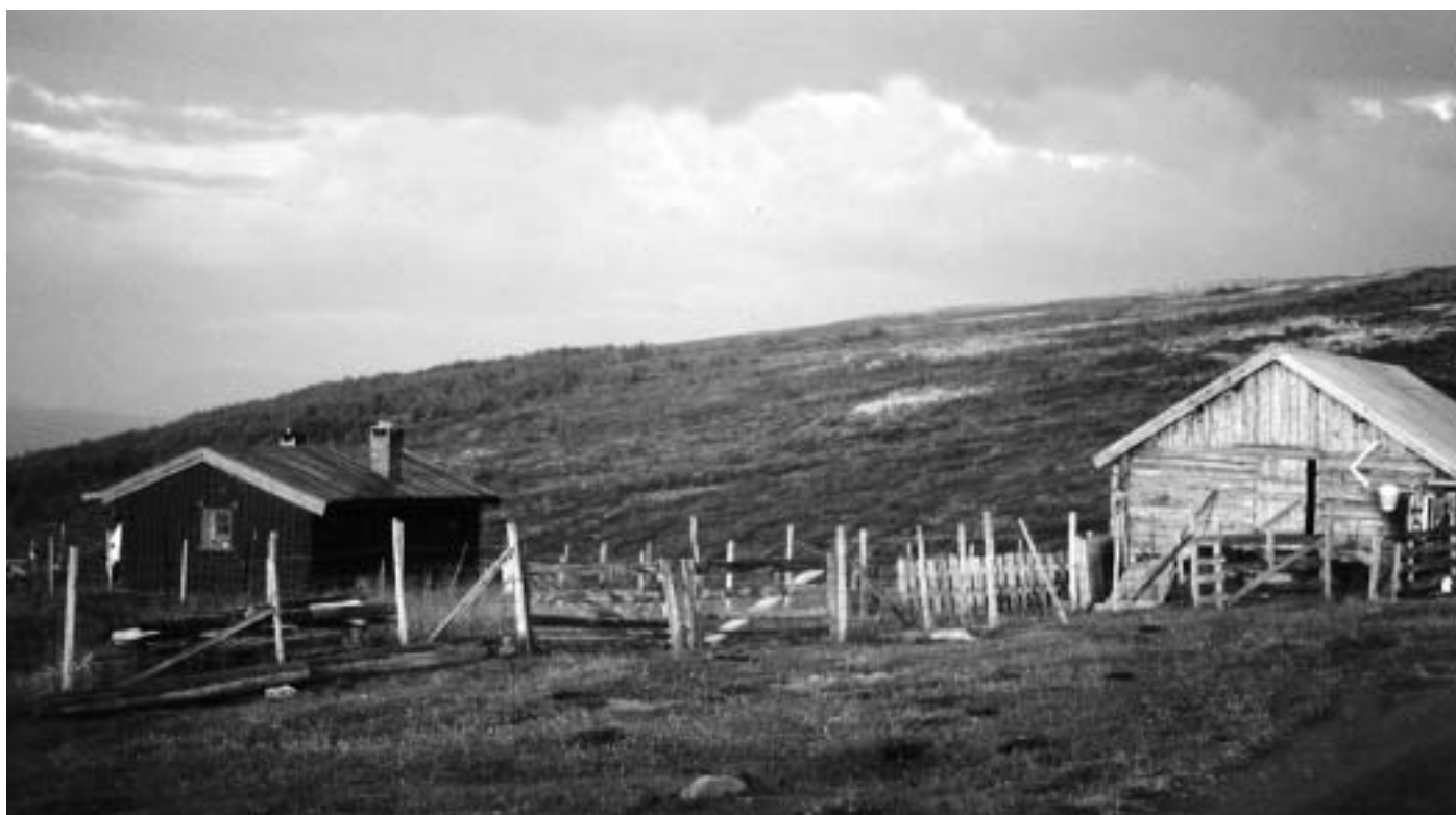
Bøsetra i Lesja – med historie tilbake til 1700-talet.