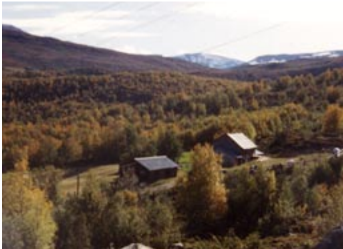
Skånsarsetra i Meadalen i Lom.

Ei lita pause ein laurdagsefta i oktober 2004 - for å: