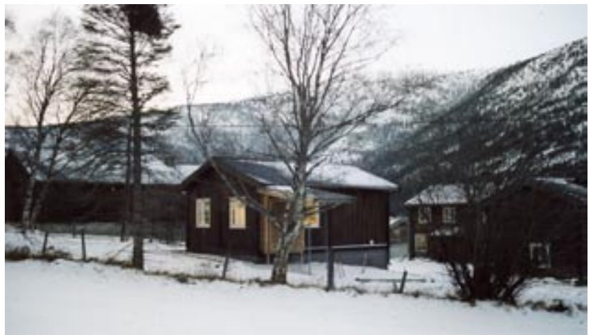
Utsikt utover tunet i novemberlys. Gardsysteriet framst med ljøs i vindauga.

Meadalen er eit viktig område for primærnæringane – og omvendt. Dette gjer også sitt til at bygdafolk og tilreisande kan nyte godt av godene dette området har å by på – lett tilgjengeleg både sommar og vinter, godt eigna til fritidssyssele og rekreasjon, avsluttar dei engasjerte brukarane på Skånsar.