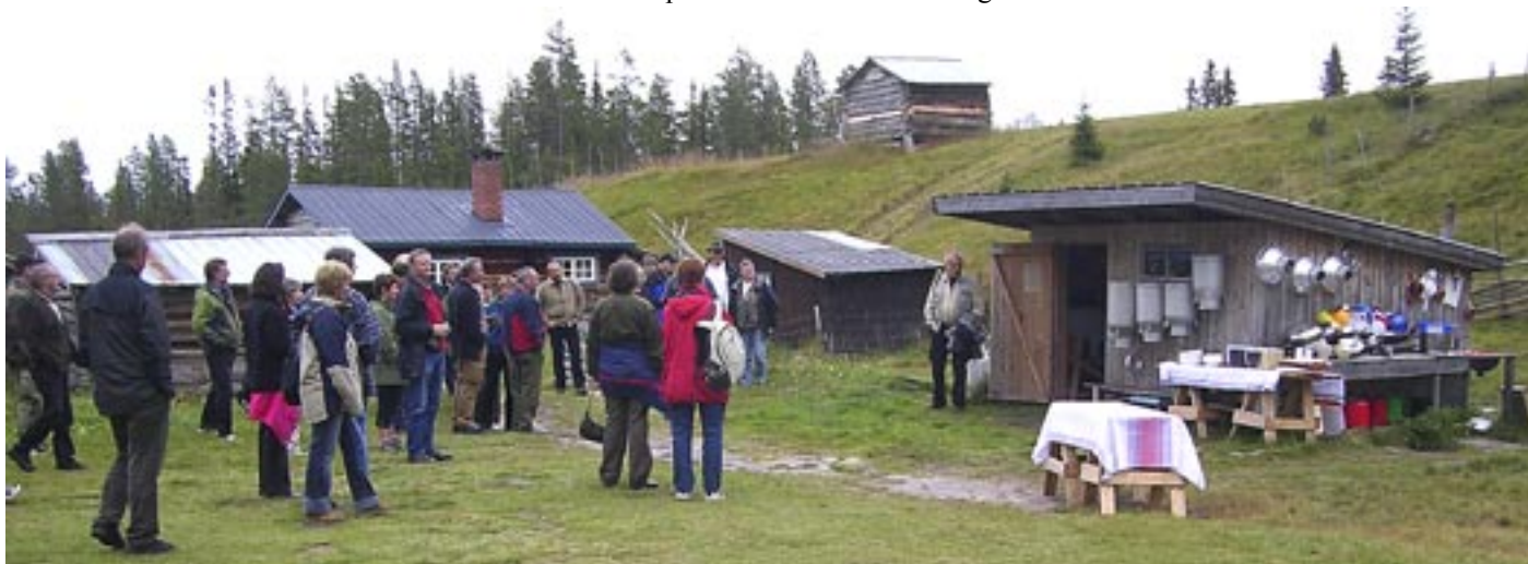
Fra Johankölens fäbod i Klövsjö i Jämtland en av de samarbeidende setre. Bildet er tatt i forbindelse med en studietur som trønderske seterbrukere gjorde tidligere i år

Setertreffet var en del av prosjektet Grenseløs seter – Fäbodrieket i Nordens Grønne Belte, som har som målsetting å formidle og levendegjøre verdiene i seterbruket. Som en del av dette vil en utveksle erfaringer og skape nettverk mellom seterbrukerne i de to landene. Treffet i Rennebu viste at en har mange felles trekk.