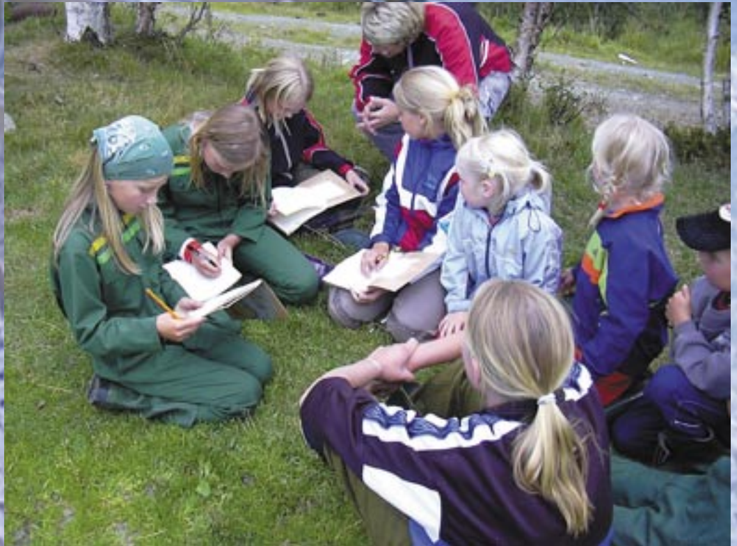
Seterliv som fellesprosjekt for elevane ved Voll skole i Rennebu.

SKRIFT FRÅ NORSK SETERKULTUR NR. 4 – DESEMBER 2004 – 7. ÅRGANG