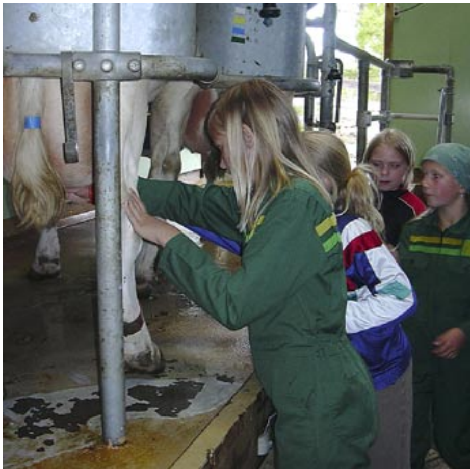
Artig å mjølke.

Vi skulle få vere med på kveldsstellet og alt som må gjerast då. Kyrne måtte sjølsagt hentast inn. Nokre prøvde seg med kulokk for å få kyrne til å kome. På felles-setrene sto kyrne i "kø" og venta på tur, medan på dei minste setrene fekk alle inn på ein gong. Dei ulike setrene hadde ulik merking på kyrne, bl.a. på kor mykje kraftfor dei skulle ha. Det var spennande å finne ut av. Alle setrene hadde sjølsagt mjølkemaskin, men kyrne måtte "mjølkast tu" for å sette i gang utdrivinga. Mange gilde ungar torde prøve seg på det. Det vart både mjølking direkte i munnen og til å sprute på kvarandre - tålmodige dyr var det i alle fall. Opplevingane var mange og ulike. Separatoren var ei ny erfaring for mange. Det er ikkje lært på ein gong å sveive akkurat passe fort for å skilje fløyte og mjølk. Etter fjøsstellet måtte fjøsrøktarane svare på spørsmål dei eldste