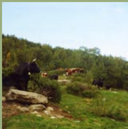
Meadalen i Lom i år 2000.

Gry bjøllku med flokken, heimkomst til setra.