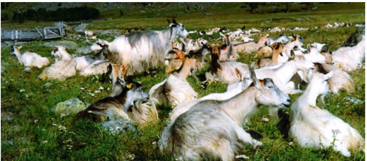
Geit blir brukt til skøtsel av landskapet på Golsfjellet.

Det andre området prosjektet skal sjå nærare på er Golsfjellet. Dette fjellområdet er viktig både for landbruket og reiselivet. Gol kommune har 30-35 setre i drift. Om trent halvparten av det dyrka arealet i Gol finns i fjellet, så landbruksinteressene er svært tydelege. Gol er også ein tung reiselivskommune med store hotell og mange hytter. Og presset på meir hyttebygging er stort. I tillegg til kombinasjonen landbruk og reiseliv/hytter, er også samarbeid eit viktig nøkkelord for at Golsfjellet er spesielt interessant å sjå på. Golsfjellet utmarkslag har i lag med reiselivet vore pådrivarar for å få til eit heilskapleg grep på planlegging i dette fjell- og seterområdet. Først vart det laga ein masterplan for Golsfjellet, denne vart vidareført som kommunedelplan vedteken i 2003. Planen er eit styringsreiskap både for landbruks- og reiselivsinteressene. Men seterdrifta er nedadgåande også i dette området, og landskapet endrar karakter. Tidlegare ope beite- og slåtteeareal gror til. For å bremse slike prosessar har landbruket og reiselivet sett i gang eit prosjekt der geita skal utprøvast som landskapsskjøttar. Vi kjem gjerne attende med meir frå forskingsprosjektet i seinare nummer av Seterbrukaren.