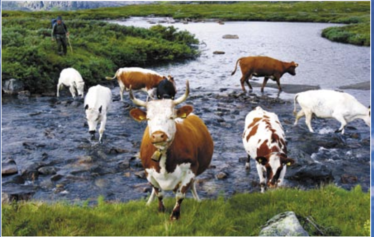
Buføring frå Stavali.

SKRIFT FRÅ NORSK SETERKULTUR NR. 3 – SEPTEMBER 2005 – 8. ÅRGANG