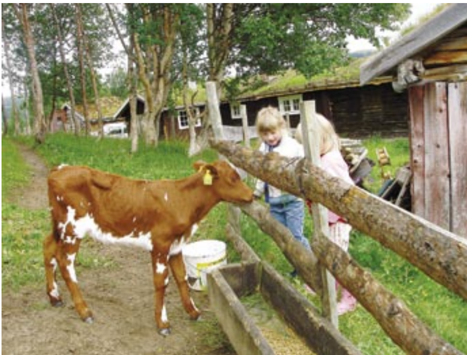
Dei yngste finn fort kvarandre

Maten som ble solgt hadde også et preg av ny og gammel tid. Til middag kunne gjestene kjøpe skjørøst, rømme og spekepølse (alt fra RørosMat), eller seterburger. På alle voller kunne en kjøpe kaffe og ”tynning” – ei lokal tjukkelfse mye brukt som kaffemat.