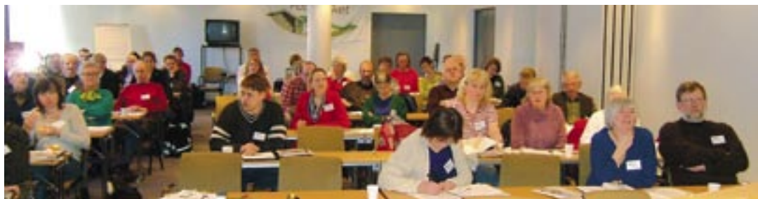
Ei lydør forsamling

gamle og unge som kom innom for å henta frå ei eng i nærleiken vart det så