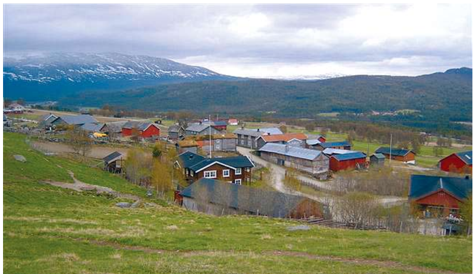
Klyngetunet med bruket til Hanne og Erling nærast.