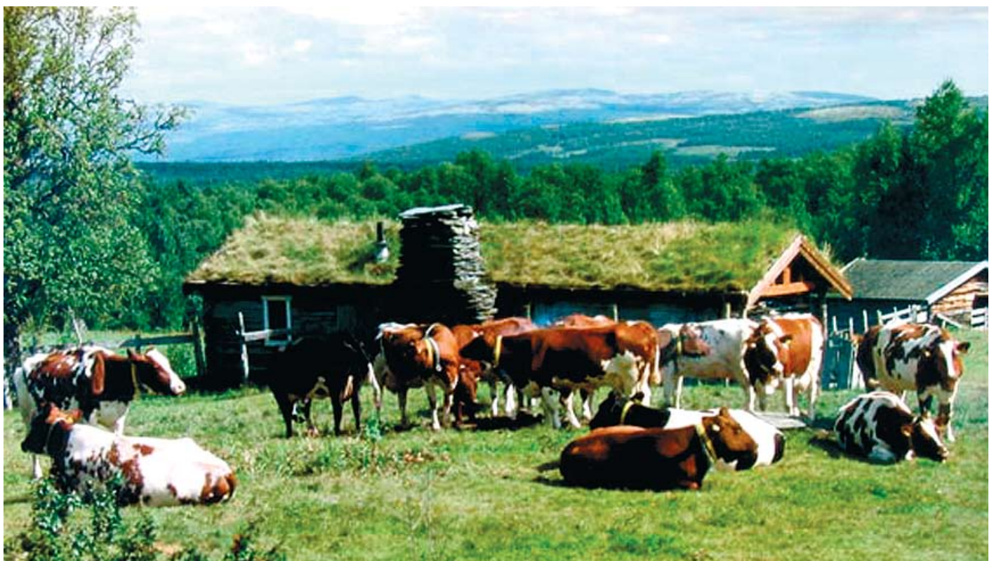
Kyrne med den gamle seterbua i bakgrunn (2003).