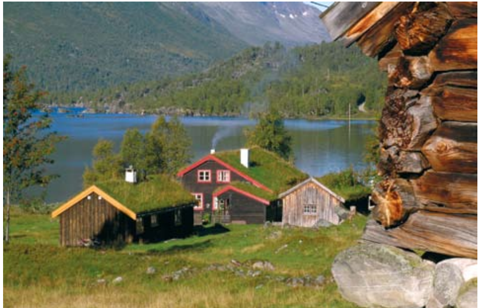
Moderne hyttebygging innebærer som oftes større inngrep i landskapet enn dei gamle seterhusa. Foto frå Rennølssetra i Innerdalen på Nordmøre der bygningar og natur går i ett.

FinseSymposiet har som formål å sette miljøfokus på høytjellsnatur og –fauna. Symposiet tematiserer årlig en konkret sak og samler faglig tunge og sentrale premisleverandører, på tvers av interessegrupper og næringsinteresser, til målrettet og avklarende diskusjon på Finse.