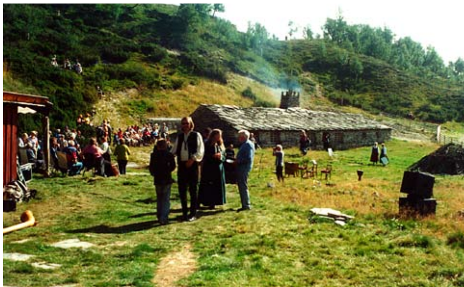
Eit flott arrangement i Rausjødalen.

Rausjødalen i Tolga var arena for Tine si markering av meierisamvirket 125-årsjubileum laurdag 26. august, men også eit stort ope arrangement søndag 27. august. Anledningen var markeringa av at Nord-Europas første samvirkemeieri kom i gang der for