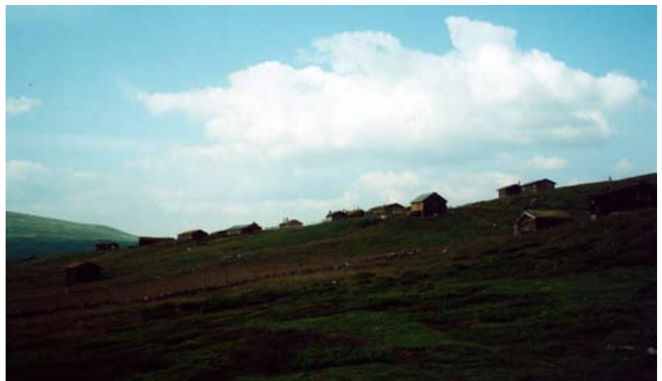
Tollevshaugen i Grimsdalen.

Grimsdalen er elles landskapsvernområde, omgjeve av Dovre-Sunndalsfjella og Rondane nasjonalparker. Grimsdalen byr på interessant kvartærgeologi med mange landskapsformer frå siste istid, og både plante- og dyrelivet i området er sjølsagt viktig for vernevedtaka.