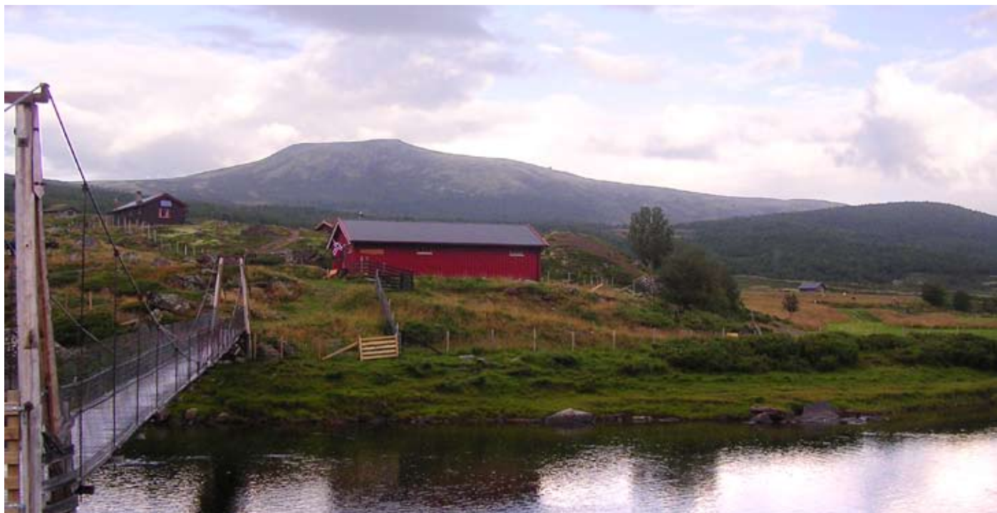
Hengebrua over Einunda fører til den nye seterkafeen.

Landets lengste seterdal har fått seterkafé