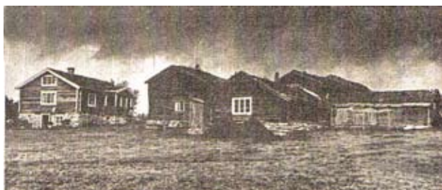
Fjølburøsta. Setra Til Mikkelsgården i Ferangen.

som gardane, 8-10 km frå dei. Husa er gode. Som regel er det på kvar sæter 2 buer, ei lita vanleg sæterbu og ein tohøgds bygnad. Om sumaren sit dei i det minste huset, men i midten av oktober når snøen og kulden kjem, flytter dei inn i bygningen som er bygd til vinterhus men kokinga held gjerne fram i kokketuset i sommarhuset. Feragenfolka reiser på sætra i juli, etter at dei er ferdige med slåtten, og held fram etter den vanlege sumarsetra med vintersete til jol, stundom til mellom jol og nyttår eller over jol – ettersom isen på Feragsjøen legg seg. Ferda heim går for seg på isen. Legg isen seg svært sent eller det lagar seg til hâlis til joletidar, sit dei til over jol. Då reiser dei til Røros og gjer jolehandel og heile huslyden høgtidar jola på sætra. Som regel er det djup snø over isen ved heimferda, men vegane er godt oppbrøytt av mose – og vedkjøringa, og avstandane er ikkje større enn at dei kan finne ein godværsdag til flyttinga. Som regel går det då godt. Fore