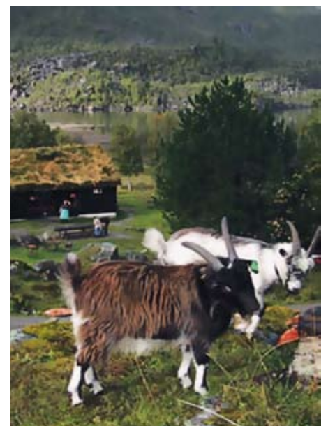
Bilde frå Renndølsetra i Innerdalen.