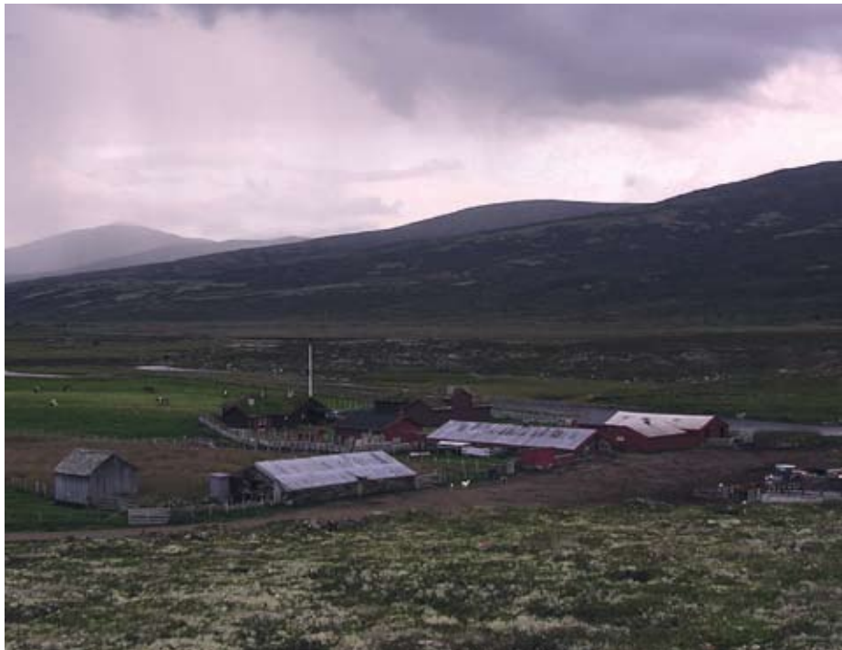
Meløya i Einunndalen, Folldalen.