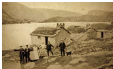
Foto frå 1914.

I denne buføra var det var det ikkje rom for noko ekstra, me sleit med vind og snødrev. Komne bort over fjellet eit stykkje stavra gamle kyra vår og vart liggjande. Nokre spreke ung-gutar vart sendt snarvegen om ”klype” og ned ”luren” til Bossvaten for å henta pledd og ultepper og nokre tågatampar slik at dei kunne dekkja over og bitta det til. Kunne ikkje gjera det annleis, fekk berre gå frå ho slik. Syntest det var meir enn syrgjeleg, beit tennene saman; såg ikkje til sides då eg gjekk. Det bestna noko med veret men me hadde ein del snø og vassa i fran til ”eggje”. Her kvilde me ei stund før me tok til å gå ned Reisetelidi. Dei som hadde vore til Bossvaten for å henta ting og dekkja gamle-kyra med, tok oss att her.