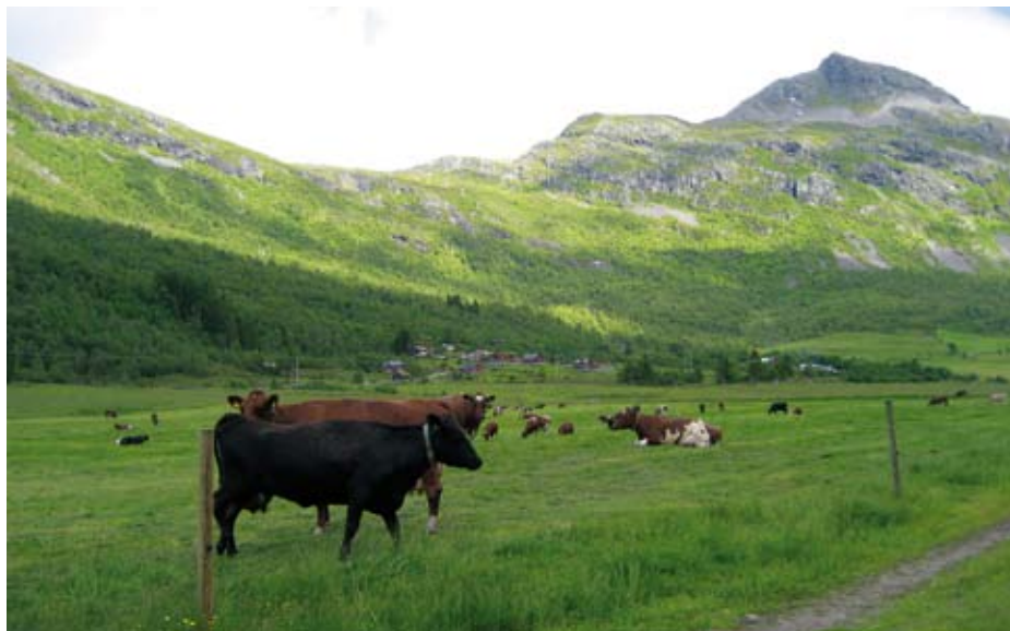
Kyrne beiter på den 400 dekar store innmarka.

Vi leverer mjølk for ein million dei tre månadane vi er på setra. Drifta går bra og vi føler vi både har greidd å ta vare på det gamle stølsmiljøet og skape nytt for framtida. Dyrkinga og bygginga for snart 30 år sidan var litt av eit løft, men vi angarar ikkje.