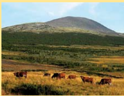
III. foto. Bård Bårdløyken. www.heidal.no