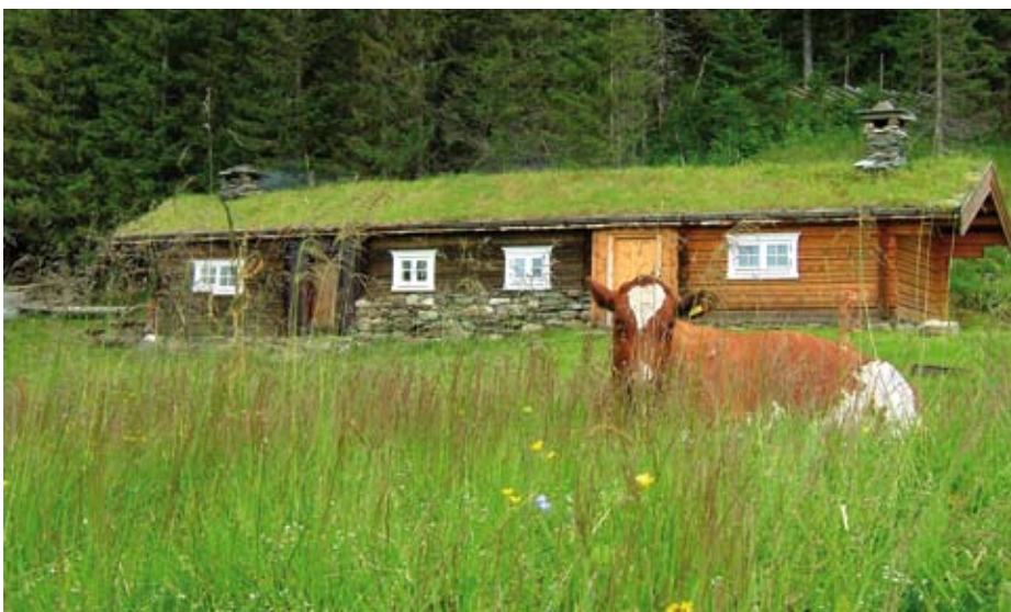
Skarlandsetra i Høylandet kommune.

I Nord-Trøndelag ble det lagt stor vekt på tilskuddsordninger som stimulerer beiting og seterdrift, og for å få i gang ny drift på nedlagte setre var det nødvendig med nytenking og sterke virkemidler. Det ble innført miljøtilskudd til beiting både på innmark og i utmark, og setertilskudd som varierer fra kr. 15000 til kr. 50000 avhengig av driftsform og miljøgevinst. Det høyeste tilskuddet gis til såkalte besøkssetre, der det ikke stilles