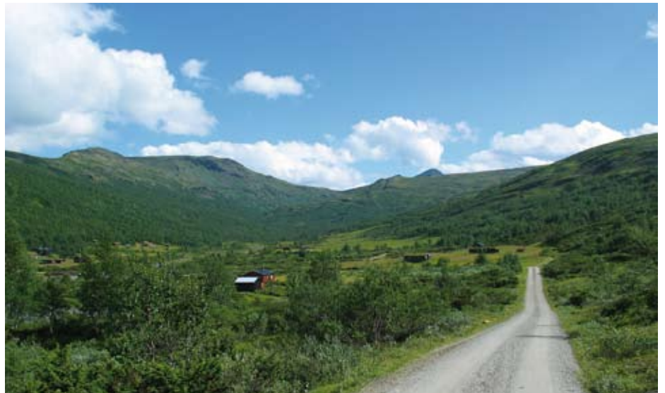
Sunnerdalen mot Hogna i Budalen.

Kan ein finne dei same skilnader i typisk og utypisk bonderolle innan gruppa seterbrukarar? I dei to områda som er studert i dette forskingsprosjektet skulle ein i utgangspunktet tru at seterbrukarane – bøndene – var svært ulike. Golsfjellet som seterområde er prega av fôr-dyrking i relativt stor skala, her er det rundt 1000 hytter og fleire overnattingsbedrifter. Rundt 40% av dyrkingsarealet til