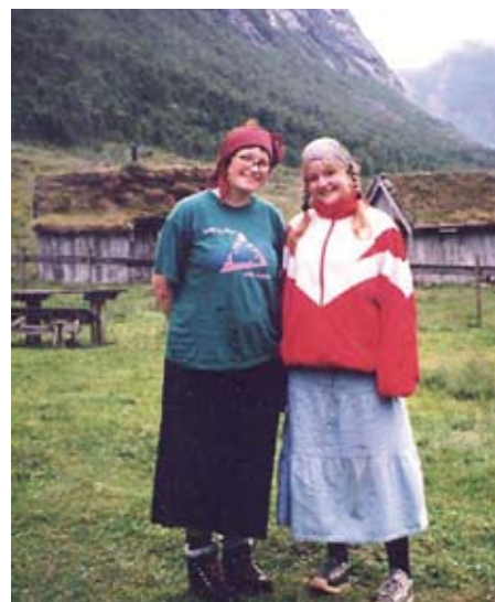
Fornøgte "spatakistar" på setra.

Alle deltakarar (både på seter, gard og beitelag) skal vere utplasserte i minimum 10 dagar. Nokre er med i lengre periodar