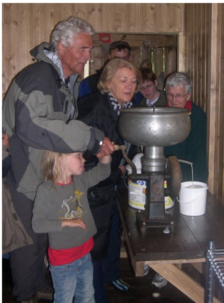
Det tradisjonelle seterstellet byr på mange spennande opplevsalar.