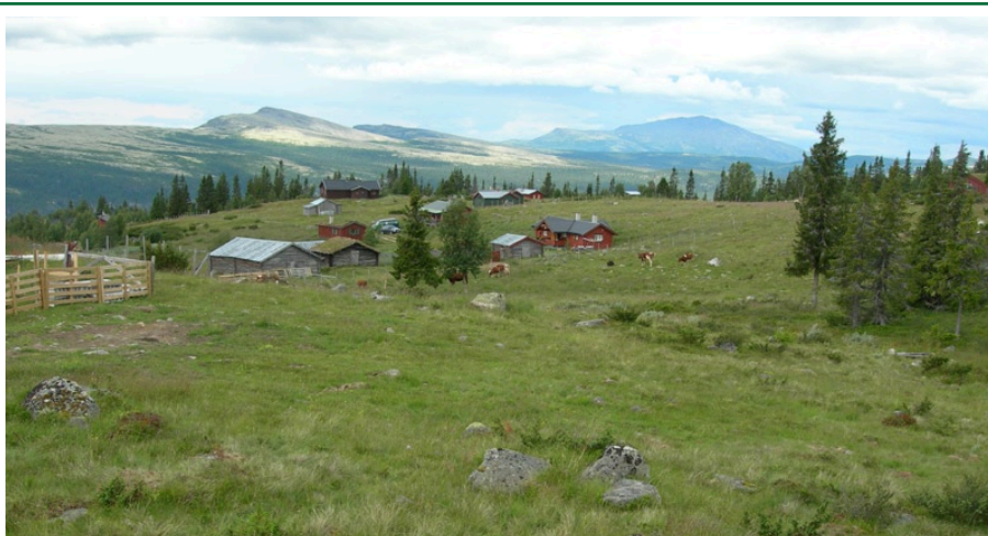
På Nysætra i Rendalen er det drift.

Norsk genressurssenter er et rådgivende og utøvende organ for Landbruks- og matdepartementet. Senteret initierer og koordinerer aktiviteter innen bevaring og bruk av nasjonale genressurser. Senteret er en avdeling ved Norsk institutt for skog og landskap.