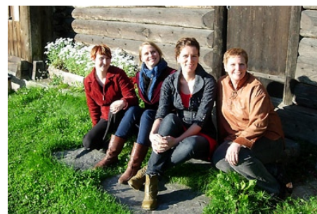
Grappa Gjetord ynskjer å reisa på seterturné.