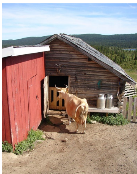
Svanei, vestlandsk fjordfe, ventar på mjølking på Flauseetra i Fåvang.

Resultatene etter første år viste at innholdet av noen målte antioksidanter økte kraftig på fjellbeite. I sommermelken fantes det mellom 50 til 100 prosent mer vitamin E og