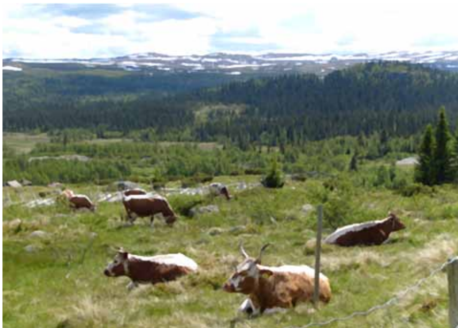
Selv de travleste bymennesker finner ro her til lyden av stillhet.

De fleste norske setre i drift ble lagt ned på 50- og 60 – tallet og ansvar og ønske om å videreføre levende seterdrift ligger hos den enkelte setereier. Det bør være interessant for den enkelte å se på hvilke ulike muligheter som finnes for å øke tilgjengeligheten for allmennheten. F.eks. samarbeid med turistnæringen, tilrettelegging av pedagogisk program for grunnskolen, salg av egenproduserte varer, utvikling av friluftsevents for små grupper samt utvikling av allerede