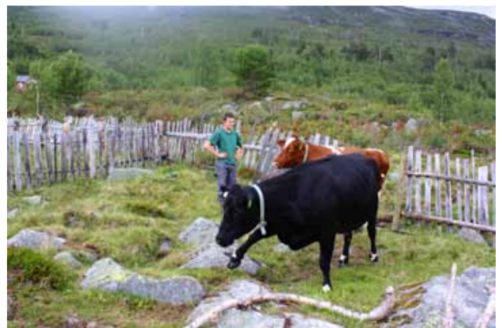
Kyrne trivst godt både ute og inne – ikkje sidan 1975 har det vore full drift på Hyrvesetra i Skjåk.