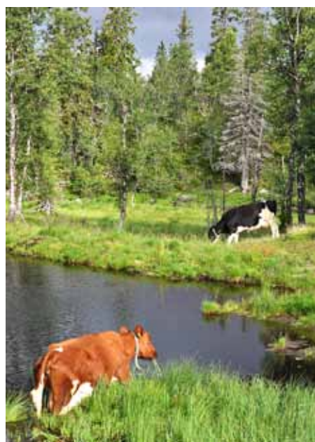
Kyr på utmarksbeite ved setra.