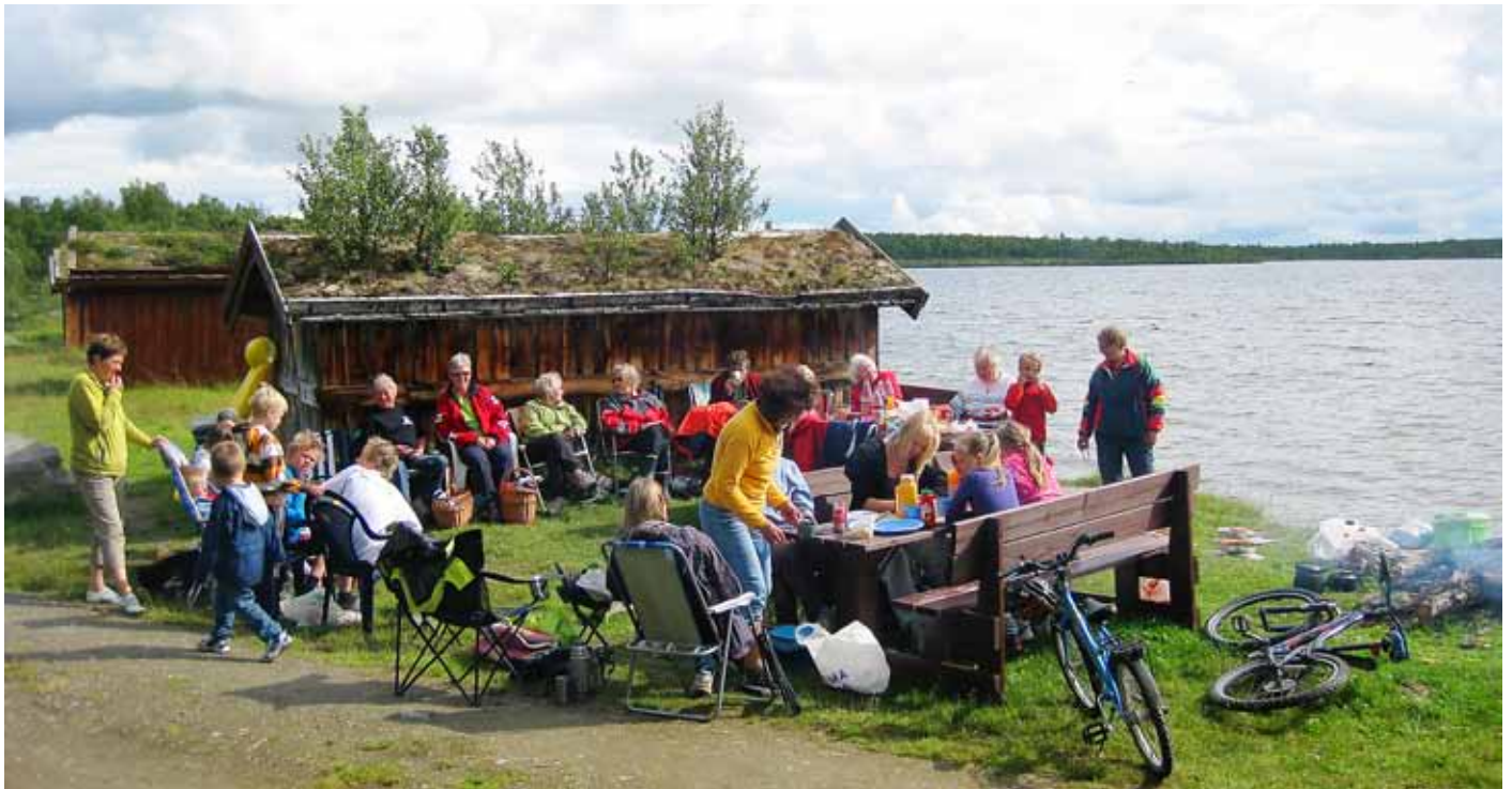
Unge og gamle budeier koser seg på budeietreff.