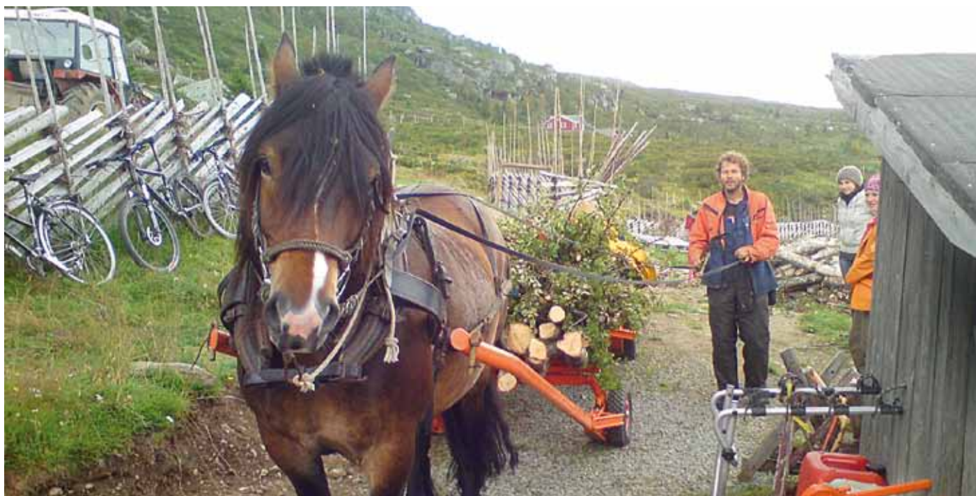
Thomas og tungdølen "Tordenskjold" har tatt ut bjørkeved og kjerv med lauv i fjellbjørkeskogen på stølen.

- På stølen holder vi også kurs for voksne eller ungdommer som vi kaller "Smak av stølsliv". Her får deltagerne være med å hente geitene, melke, yste og gå på tur for