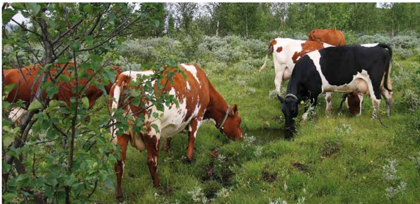
Kyr på beite.