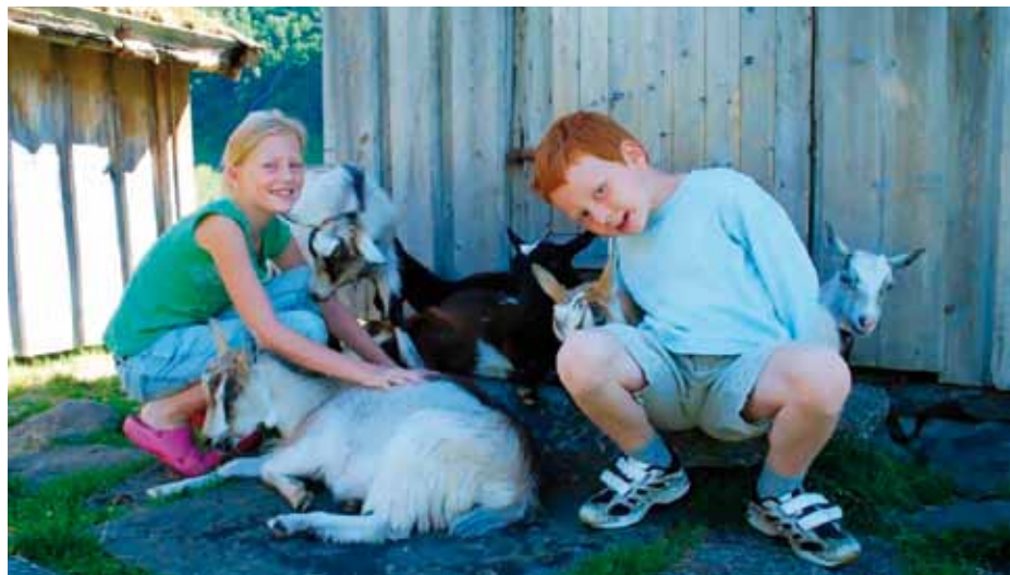
På setrene kan ein få nærkontakt med dyra, viktig for både små og store gjestar.

I løpet av neste år skal jeg sammenligne seterdrift i Norge med seterdrift i Sveits, Østerrike og Frankrike. Formålet er å finne gode bærekraftige løsninger på fortsatt lønnsom seterdrift i Norge slik at politikerne våre kan forstå at småskalaproduksjon har høy verdi: både økonomisk, biologisk, sosial og kulturell”.