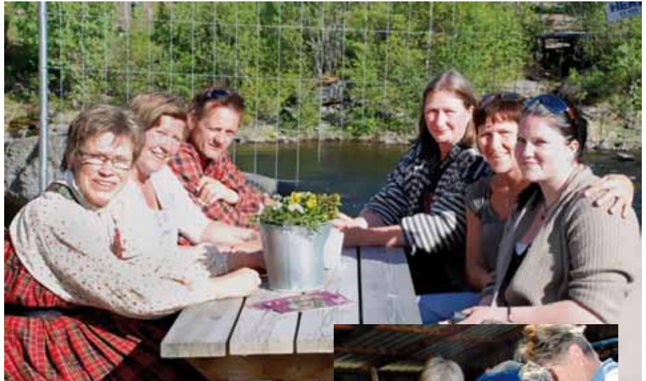
Ein sliten men fornøyd gjeng fra Budeienettverket klar til å rigge ned og rydde Stølsvollen sist sesong.