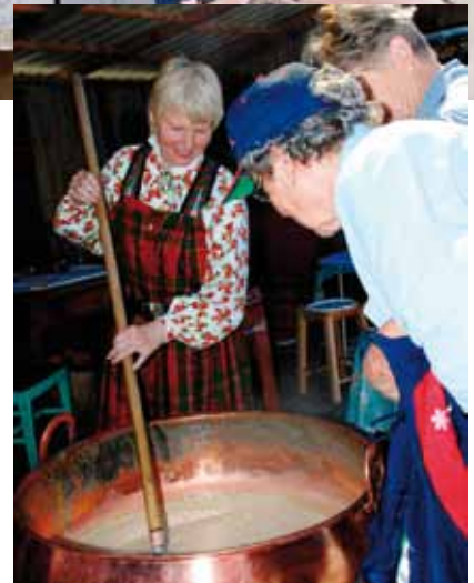
God lukt av ferdigkokt dylle fikk folk bortåt kjelen.