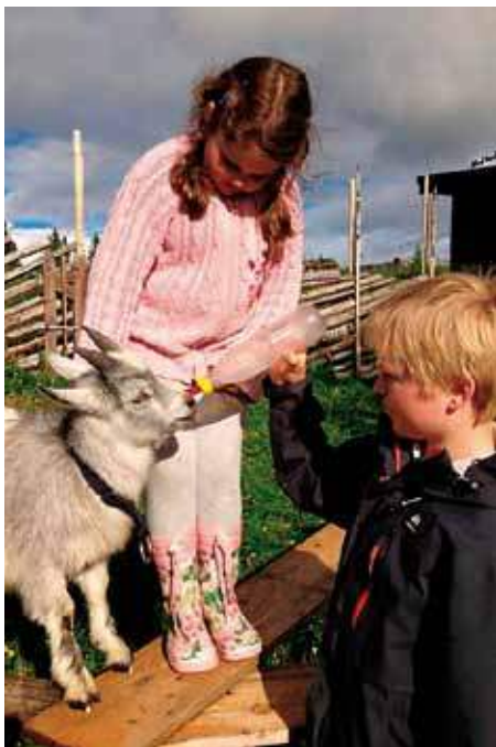
Dei små dyra på setra må også få godt stell.