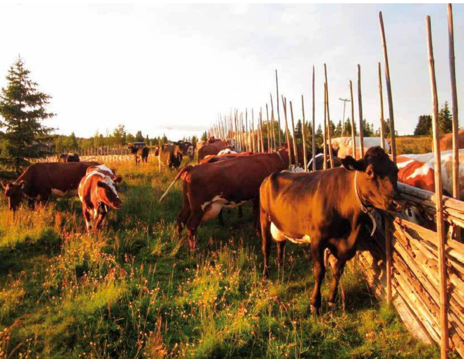
Litt krangel over skigarden i kveldssola.