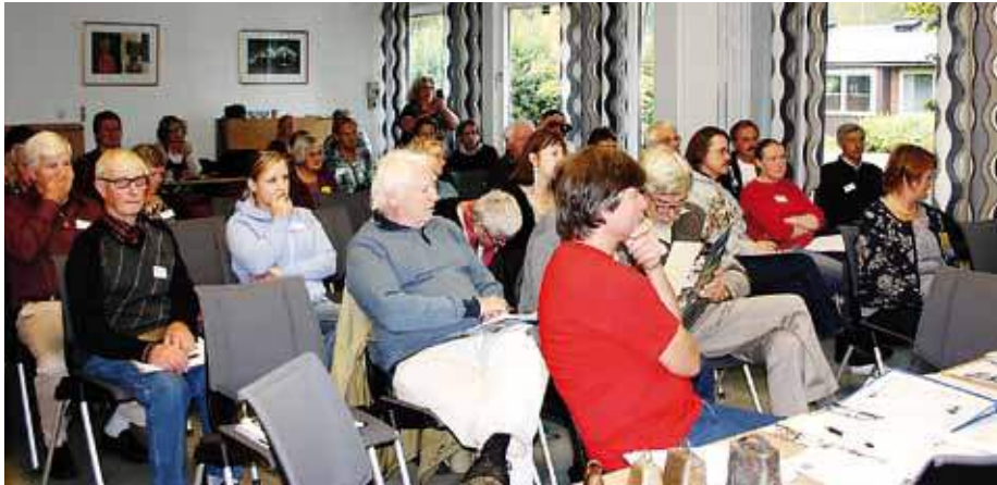
Fäbodriksdagen samler mange seterbrukere.