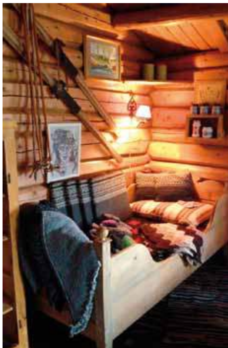
Kjekt å koma inn i velstelte seterhus.