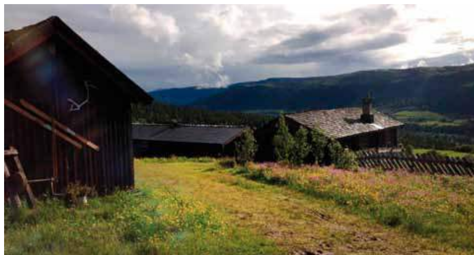
Tagestad seter ligg fint til og med flott utsikt.

har sett innslaget med henne der da ho vart intervjuet i programmet "Status Norge: Bondelandet" på NRK. Eit flott innslag for både seterdrifta og landbruket samla. – Kyrne beiter både på innmark og utmark, siste åra har det vore for mykje regn til at ein har kunna hauste noko av innmarka – og kyrne har greidd seg utan tilskot av rundballfor. Kyrne er inne berre til mjølking, elles får dei gå fritt.