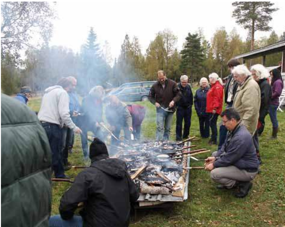
Fäbodriksdagen er et godt arrangement både faglig og sosialt.

Styret i Norsk seterkultur viste til en tilsvarende utvikling på norsk side, med stort frafall både fra stølsdrift og melkeproduksjon generelt. Styret viste til at selv om det er lett å få melkekvote, er utgiftene økt uforholdsmessig mye i forhold til inntektene, slik at mange vegrer seg for å overta. Styrene konkluderte med at vi har mange felles arbeidsområder både politisk og faglig, og en ble enige om å arrangere en felles norsk – svensk konferanse i grensetraktene høsten 2013. Nærmere dato og program kommer vi tilbake til i senere utgaver av Seterbrukaren.