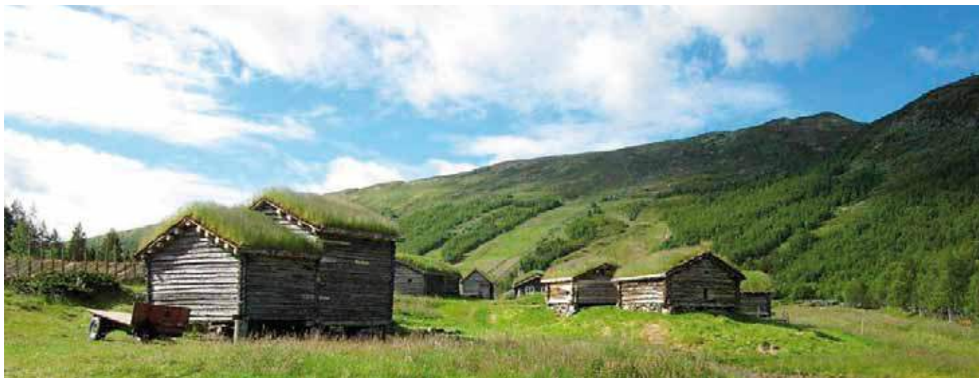
Dei store husa er i ferd med å koma attende til fordoms prakt.