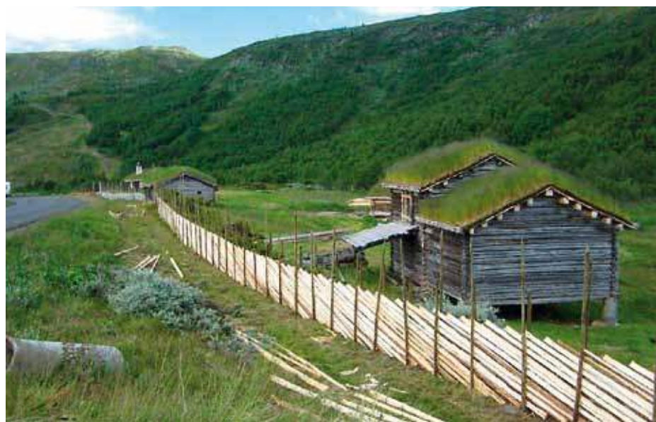
Skikkeleg skigard høyrer med.