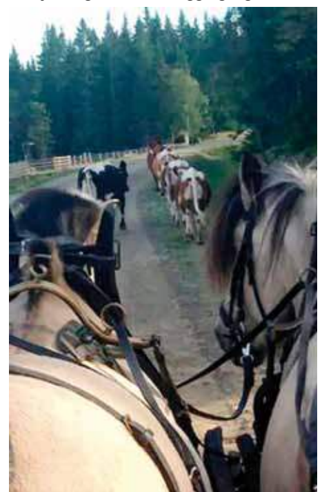
”Fjording, dølahest, STN, telemarkskyr og seterlandskap, kan vel ikke bli mer norsk?”