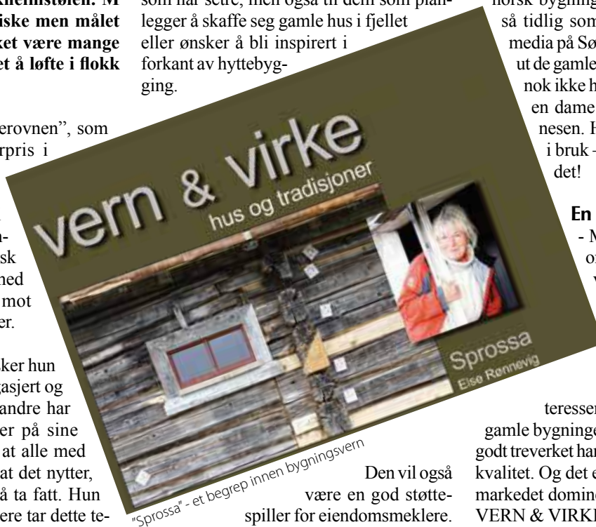
"Sprossa" - et begrep innen bygningsvern

Boken henvender seg først og fremst til alle som har setre, men også til dem som planlegger å skaffe seg gamle hus i fjellet eller ønsker å bli inspirert i forkant av hyttebygging.