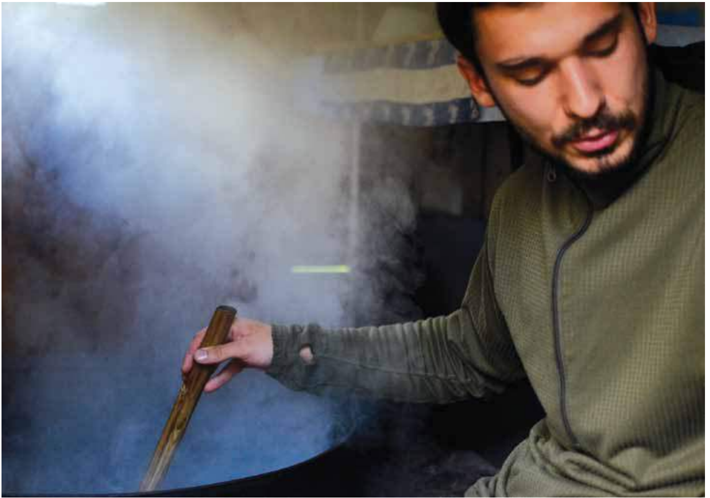
Hjemmelaget geitekaramell fra Herdalssetra lages i en stor jerngryte. Det tar som regel 6-7 timer å få karamellene ferdige.