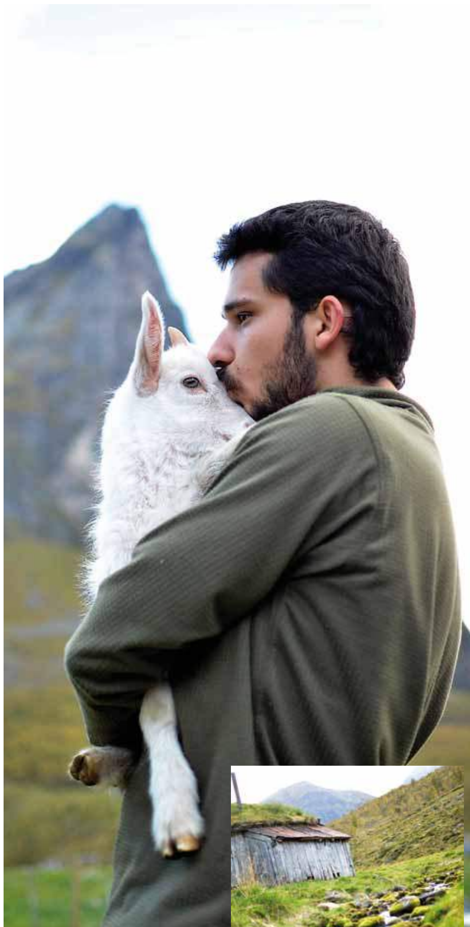
Geitene på Herdalssetra sørger for at kulturarv og biologisk mangfold bevares ved at de beiter hver sommer. På stedet finnes det en rekke arter som står på norsk rødliste - en oversikt over truede arter i Norge.

Flere av seterhusene er over 300 år gamle.