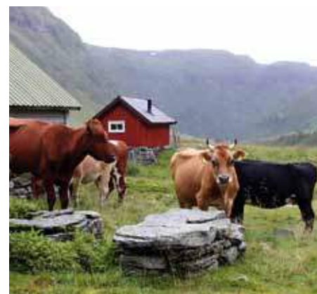
Frittgående beitedyr trekker ofte til stølene, og gjør sitt til å holde det åpent og fint. Denne brokete gjengen bød på hyggelig selskap og delte min interesse for kløvsteinene på stølen i Voss.

Det blir spennende å se hvilke verdier myndighetene vil vektlegge i kommende miljøstrategier. Viktigst er det imidlertid at seterbrukerne selv, både fritidsbrukere og næringsdrivere, erkjenner verdiene de sitter på, og tar hensyn til dette når bygninger og anlegg skal oppgraderes. Det må finnes bedre løsninger enn å gjøre unike setertun om til ordinære hyttetun. Fortsatt er det mange spennende og godt bevarte bygningsmiljøer å finne, og ikke minst har vi glede av å se bygningsmessige særtrekk i de ulike landsdelene. Vi ønsker at undersøkelsen vår kan bidra til å rette søkelys både på seterdrift som en livskraftig driftsform, og seteranleggene som unike og verdifulle kulturminner.