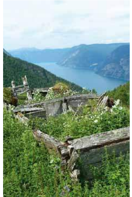
Forfall og gjengroing finner vi i seterområder i alle landsdeler. På en fjerdedel av setrene ser vi ikke tegn til bruk av noe slag. I bratte og vanskelig tilgjengelige områder er denne utviklingen lett å forstå. Årdal, foto Jan Reyer Elders, Skog og landskap.

Hva er det så vi registrerer? I hovedsak dreier det seg om hva slags bygninger og anlegg setrene består av, hvordan setrene brukes i dag og tilstanden på bygninger og setervoll. Botaniske undersøkelser inngår ikke. Registreringen baseres på våre egne vurderinger, uten at vi systematisk involverer informanter. Dette har å gjøre med begrensninger i