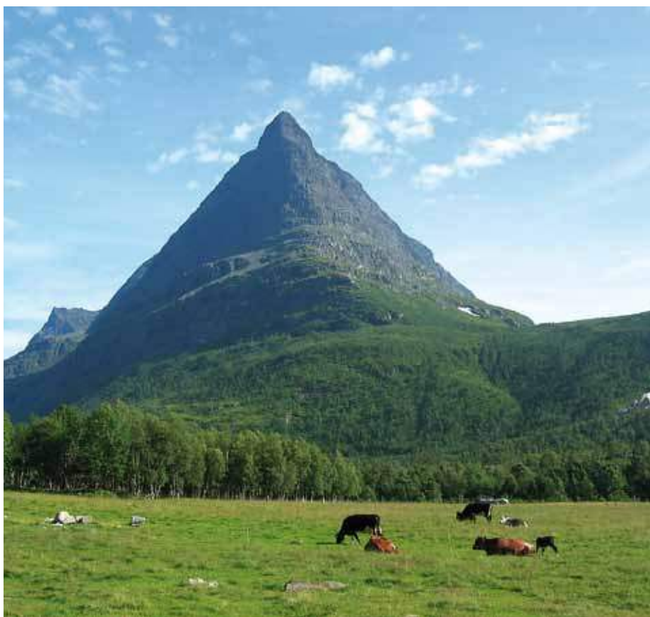
Kyr på beite i Innerdalen på Nordmøre.

gings- og tilretteleggingsprosjekter knyttet til planlegging og organisering av beitebruk.