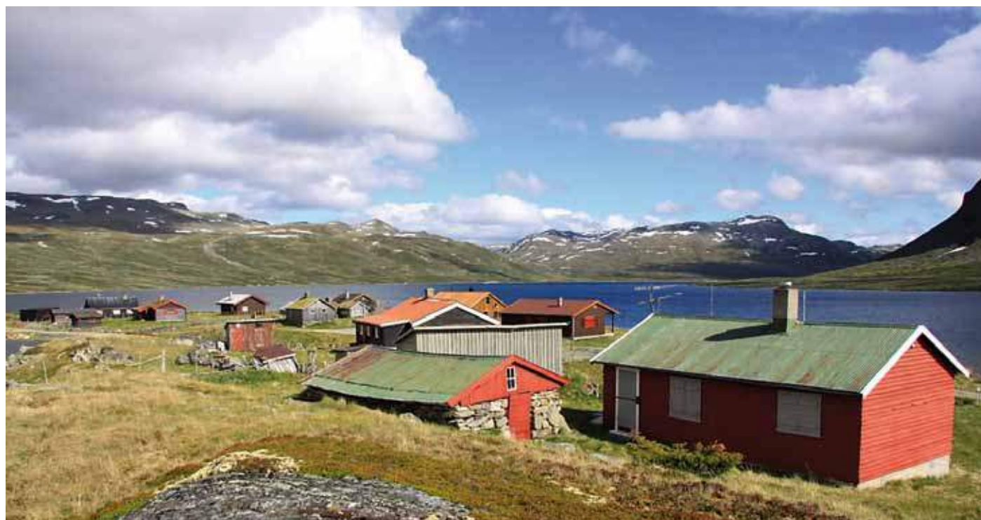
Et ikke uvanlig syn: seterhusene er gradvis blitt erstattet av hytter og snart er setergrenda blitt til en hyttegrend. Et unikt miljø endres til noe ordinært. Er det en slik utvikling vi ønsker?