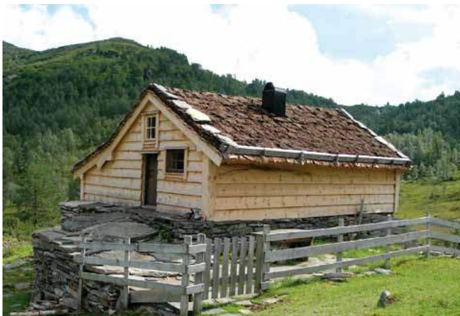
Det er stas å se at bygninger oppgraderes i tråd med lokale tradisjoner. På dette selet er form og størrelse bevart og materialbruk og gjennomføring ser ut til å være helt etter boka. Førde, foto Wendy Fjellstad, Skog og landskap.

Undersøkelsen viser at miljøkvalitetene i seterlandskapet er under betydelig press. Samtidig opplever vi et sterkt engasjement hos mange setereiere, som er opptatt av å beholde og videreføre både landskap, bygningsmiljøer og andre tradisjoner rundt seterdrift. Bevaring av seterkultur er imidlertid avhengig av aktiv drift, og setre med melkeproduksjon er i den sammenheng blitt faretruende få og rekrutteringen usikker.