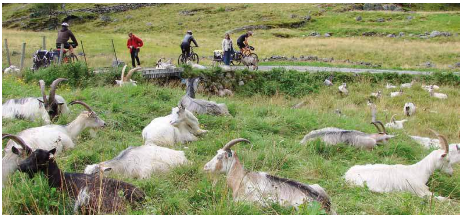
Rallarvegen går "rett gjennom" geiteflokk.

ost når du sykklar eller vandrar i Flåmsdalen er ein ting som vil auke opplevingsverdien. Ysting av mjølka på stølen vil redusera trongen for mjelketransport frå Kårdalen, noko som pr. i dag er krevjande og arbeidssamt for både brukarane og meieriet. Sal av stølsprodukt vil betre økonomien. – Stølsdrift i