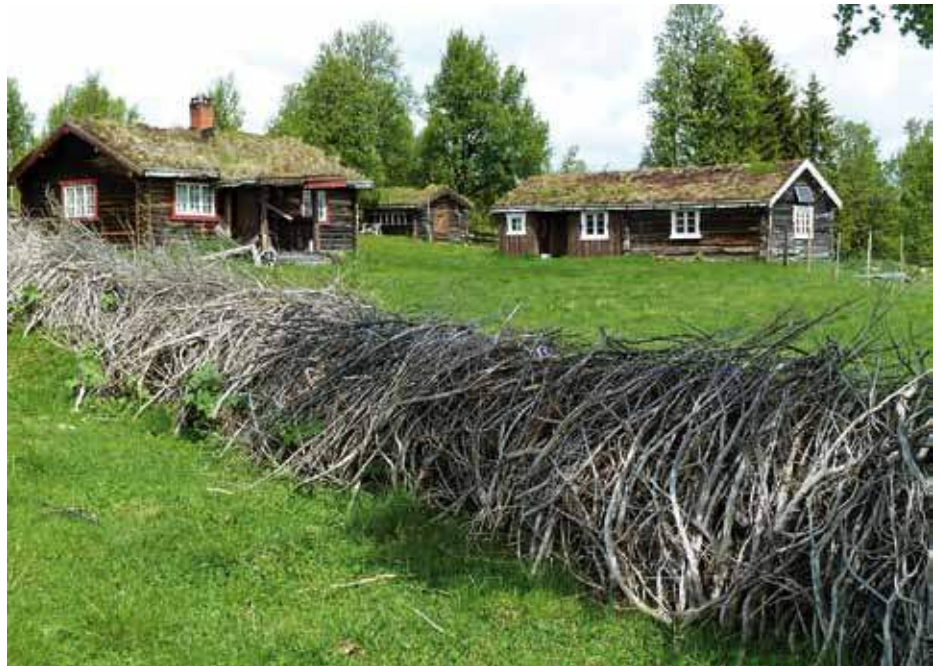
Om Ferdigheter skal opprettholdes, må de praktiseres. På Langsetra i Vingelen i Tolga har de laga enhafelle (gjerdet av einer) etter gammel skikk. Et spennende innslag for oss forbi passerende.

penget og tid. Men i heldige fall treffer vi på eiere eller andre lokalkjente personer, som kan bistå med praktisk og historisk informasjon, og gjerne med betraktninger rundt setrenes og seterlandskapets livsbetingelser. I tillegg nyter vi godt av tidligere kartlegginger og ymse lokalhistorisk litteratur. Det er ikke så rent lite arbeid som er lagt ned rundt i landet i nettopp å beskrive og dokumentere setre og seterhistorie.