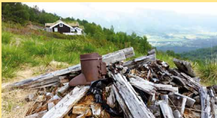
Er det denne utviklinga vi ønsker? Frå Løviksetra, Tresfjord

I verdenssammenheng utgjør små og mellomstore bruk 70 % av verdens matproduksjon. Ut i fra et matforsyningsperspektiv vil det derfor være uklokt å legge opp til en politikk der disse får dårlige vilkår.