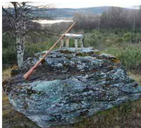
Spellsteinen på Tolga – prydar coveret på cd-en med musikk frå seterlivet.