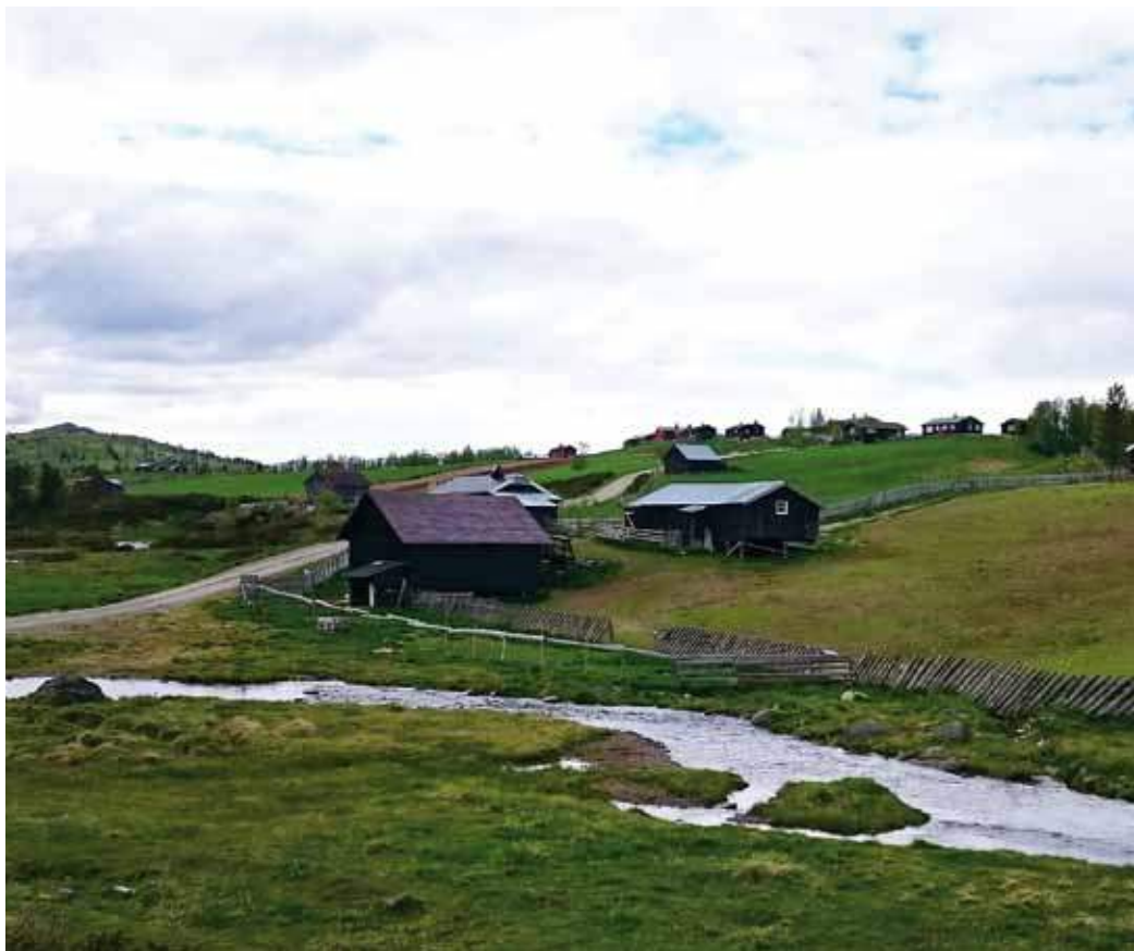
Seterlandskap i Fronsfjellet i Gudbrandsdalen.

I 2015 var Norsk seterkultur invitert sammen med samer, eskimoer og hvalfangere fra Færøene. Initiativet kom fra Nordisk ministerråd der vi sammen skulle se på hvordan vi kan ta vare på kunnskapen om