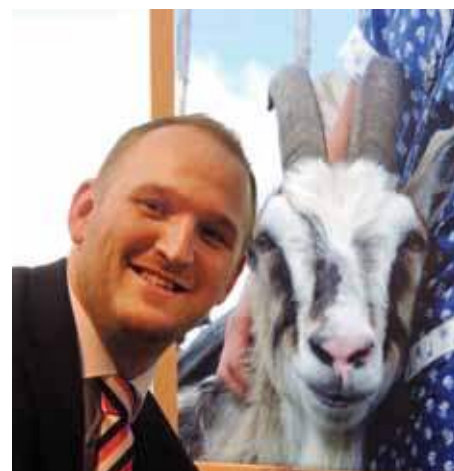
Landbruksminister Jon Georg Dale. LMD står bak den Norske deltakelsen sammen med Innovasjon Norge og Norges ambassade i Berlin.

Om vi deltar på ny i 2017 med norsk seterturisme er uvisst, men da er det i hvert fall høyst aktuelt å gjøre en annen og mer aktiv vri på standen. Vi ville da hatt mer oppvisning og utstilling omkring seterdrift og melkeproduksjon for å synliggjøre det typisk norske, og rette et fokus på det spesielle med norsk melk fra utmarksbeite og det som er annerledes i norsk seterdrift kontra alpene sin seterdrift. Men dette er med tankene, så får vi se om vi vil delta på sirkuset atter en gang. Det blir kanskje som når setersesongen er over og man er sliten og lei: Man savner det like mye hvert år når snøen forsvinner, gresset gror og solen varmer.