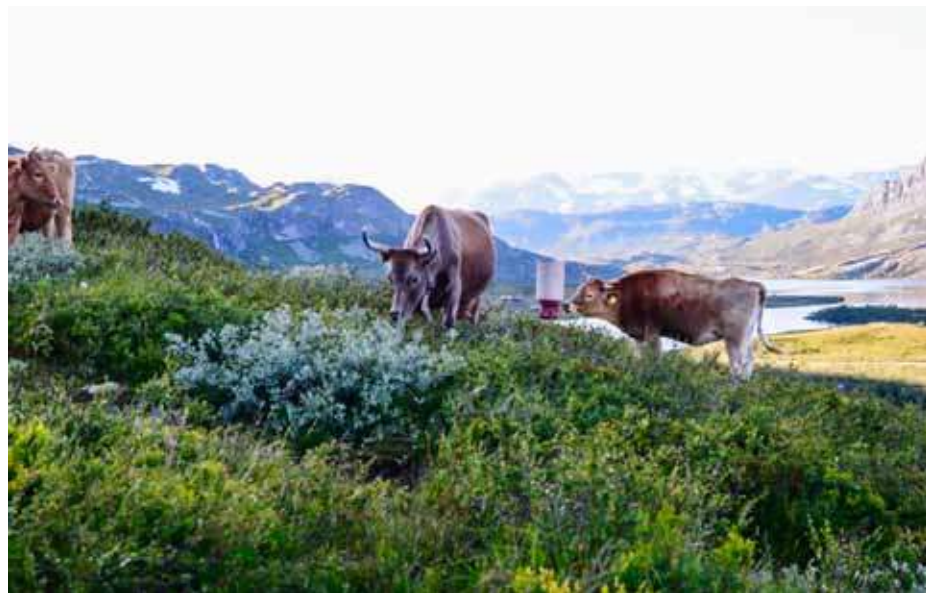
Topp stemning på setra!