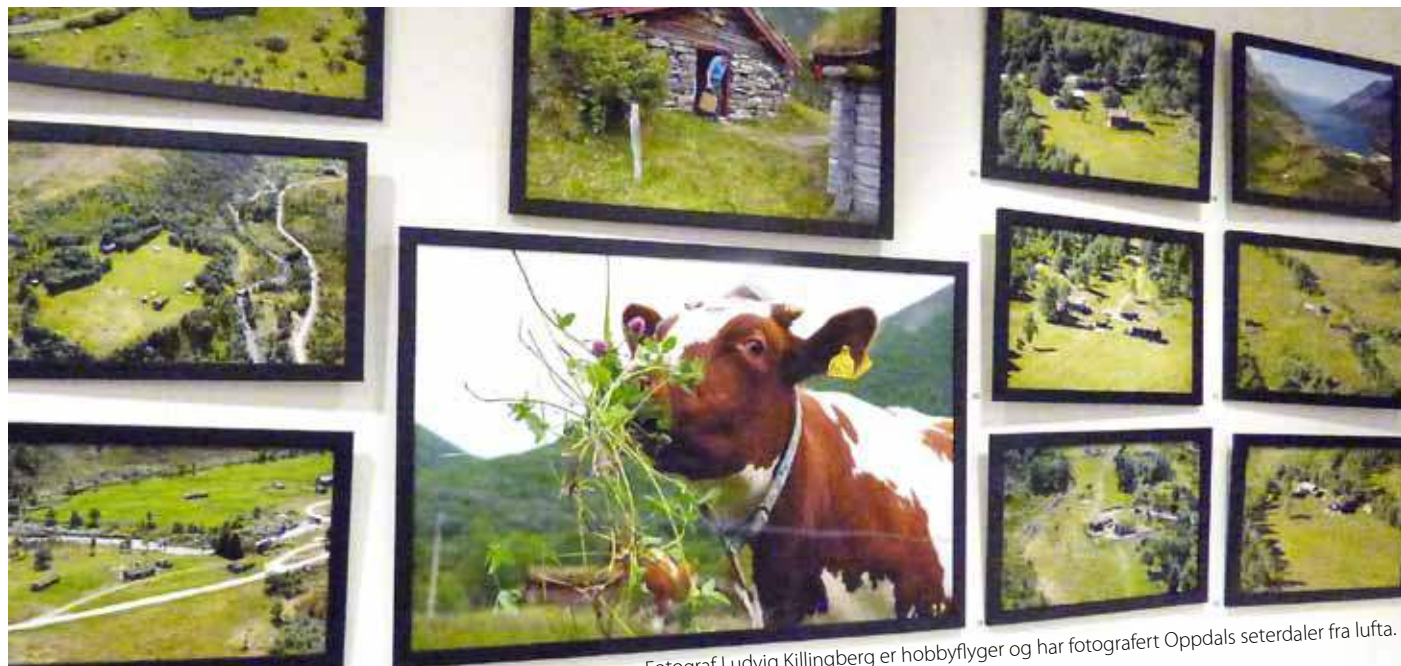
Fotograf Ludvig Killingberg er hobbyflyger og har fotografert Oppdals seterdaler fra lufta.

I løpet av den tida utstillinga stod i kulturhuset var det ca 450 som har skrevet navnet sitt i gjesteboka. Nå håper vi på å få på plass et samarbeid som kan lede fram til ei seterbok for Oppdal. Gro Aalbu forteller at det blir jobba med ei arbeidsgruppe for bokprosjektet, men at planene enda ikke er helt klare.