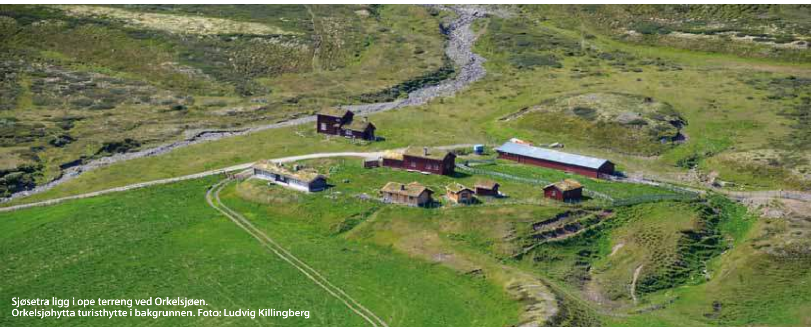
Sjøsetra ligg i ope terreng ved Orkelsjøen. Orkelsjøhytta turisthytte i bakgrunnen.