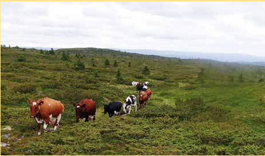
Kyr frå Sjøsetra i Øyer.