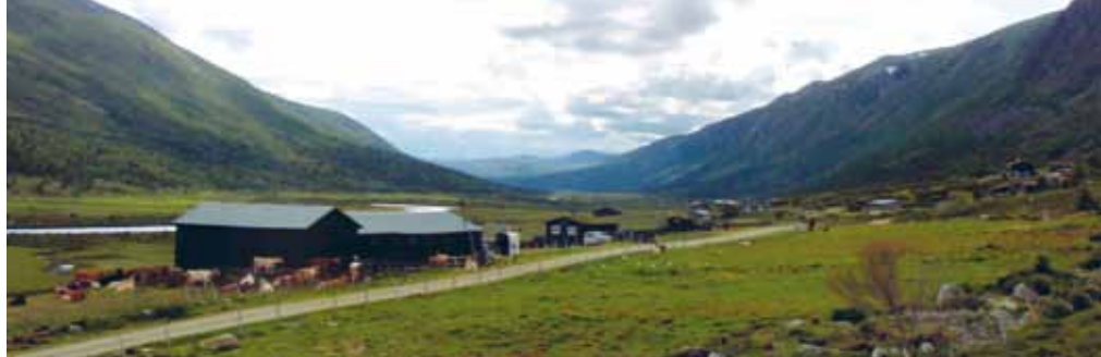
Gubhagesætra i Finndalen i Lom. Foto: Jostein Sande.

I høve til foredling og sal er det store