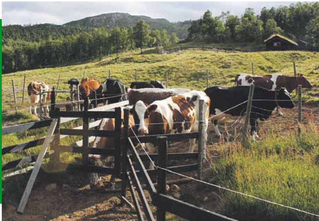
Kråkeroe-staulen Seljord i Telemark.

Grønt Spatak er eit samarbeid mellom Norsk Bonde- og småbrukarlag og Natur og Ungdom. I år feirar ordninga 25 år.