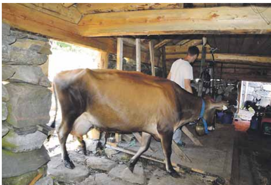
Maja kjem inn på bås.