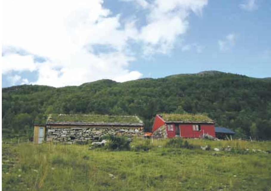
Perseterstølen på Åndalssetra.