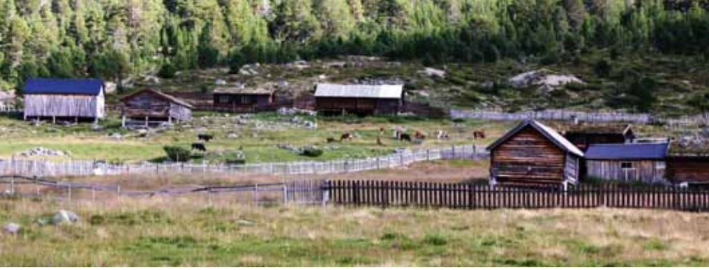
Kyrne beiter på seterkveene på Sotasetra i Skjåk.