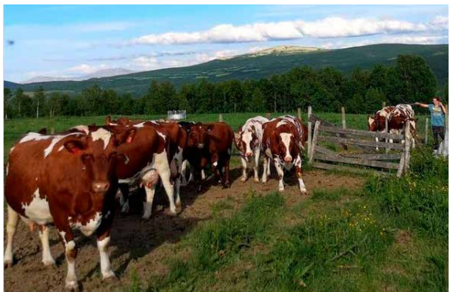
"Melkekyr på Langsetra", lagt ut på Instagram med emneknaggen #setra_mi av @maritlindjo (Marit Lind Jordet).

Ta bilder fra egen seter eller ei seter du besøker - og oppfordre andre til å gjøre det samme! Vis fram hverdagen på setra, med aktiviteter som f.eks. buføring, melking, dyrestell eller foredling. Sørg for at personer på bildene har gitt sitt samtykke til at de kan publiseres. Noen av bildene repostes på vår instagramkonto Setra_mi .