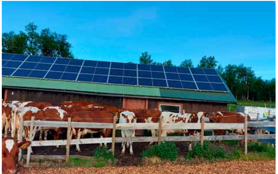
Kyrne går inn i den andre sommaren med solceller på fjøstaket.

på telefonen etter kvart, med få minuttars forseinking.