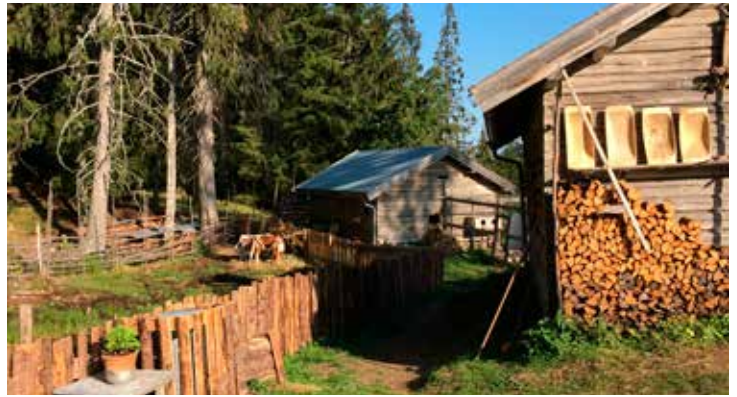
Frå Skålbergsætra.

Som eit konkret eksempel på smittevernreglar for ein stad som er open for publikum vil Seterbrukaren her visa fram generelle retningslinjer for museet Odalstunet, og smittevernreglane frå Skålbergsætra i Nord-Odal, som er Odalstunet si museumsseter: