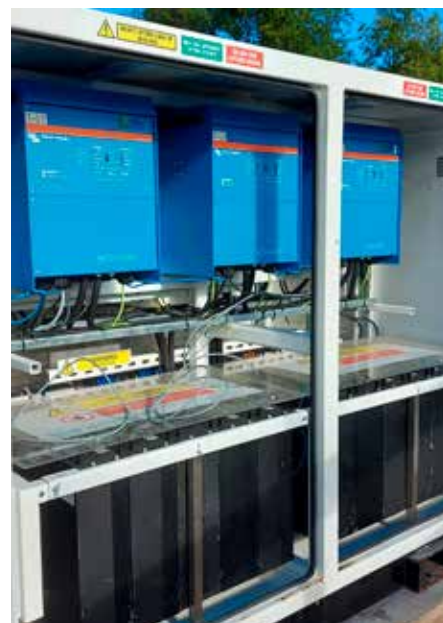
Dei blå boksane inne i batteri-konteinaren er inverterane, som gjer om solcelle-straumen til 230 volt vekselstraum. Under står batteria.

Tanken er at etter kvart som ein får prøvd ut eit system som fungerer, så skal solceller vera ei tilgjengeleg energikjelde for fleire norske setertak. Og då kan ein skru av dieselaggregatet, og roa kan senka seg over setervollen.