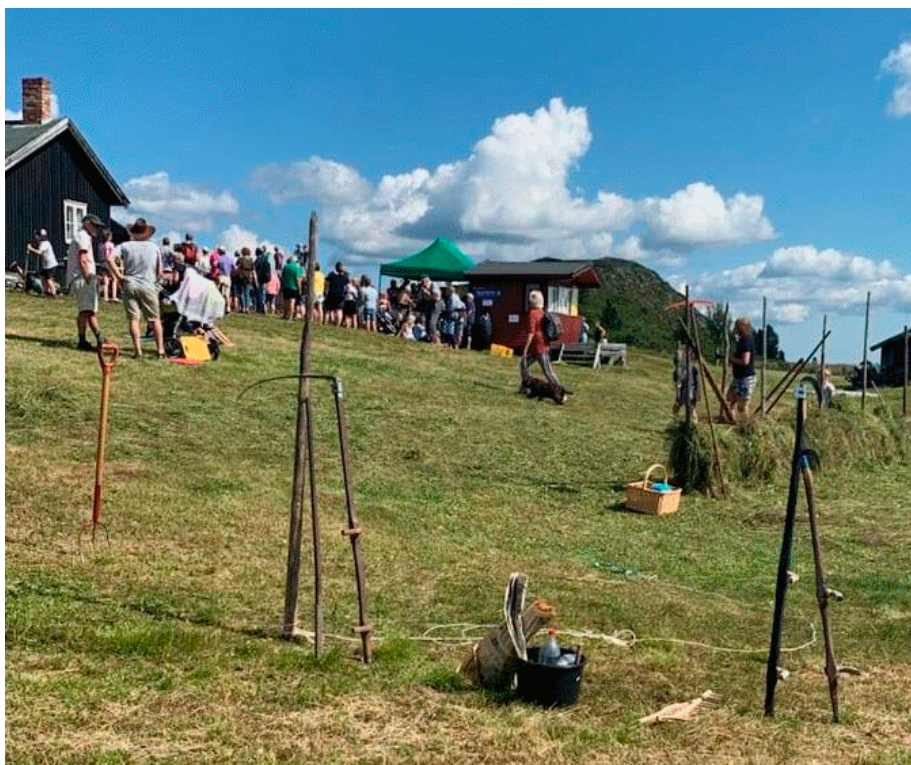
Stølsdag og høyslått på Gaurhovdstølen..

I over 30 år har det vore tradisjon med stølsdag på Gaurhovdstølen. -Den går av stabelen fyrste helga