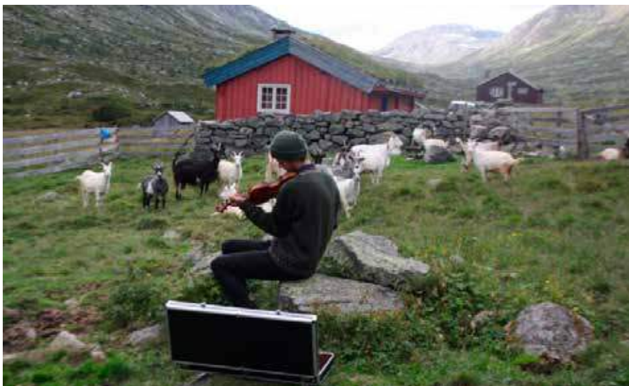
Unesco-prosjektet handler om seterkulturen. Illustrasjonsbilde: Norsk seterkultur.

Status for UNESCO-prosjektet - nominasjon av seterkulturen på UNESCOs liste over immateriell kulturarv.