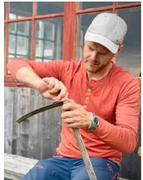
Stutturven er nyttig på stølen..

Hun oppsummerer helgen videre slik: Deltakerne har melket geitene, lært å vurdere melkens kvalitet og hvordan alt av melken kan benyttes. Maten har