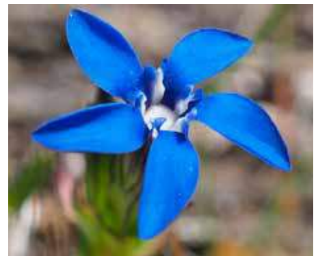
Snøsøte, © Rolv Hjelmstad.

Innsatsen for seterdrifta treng fleire støttespelarar. Bli medlem i Norsk seterkultur! www.seterkultur.no