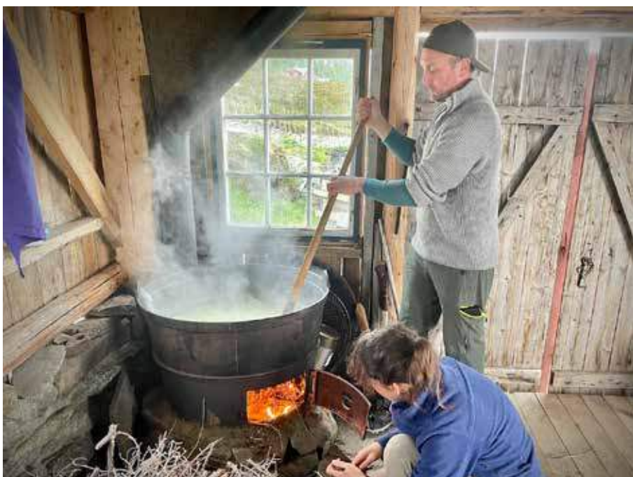
Fyring under kjelen og røring i brunosten.

- Det føles som det er en liten bølge på gang rundt disse temaene. Jeg kjenner mange på min alder som nå ønsker bokstavelig talt å putte fingeren i jorda og lære om helt elementære ting. For meg er dette et møtepunkt mellom bærekraft og livskvalitet, kanskje det er dette livet som er "moderne" i fremtiden?, spør hun.