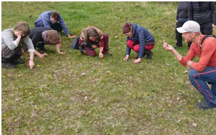
Botanisk vandring på Olestølen.