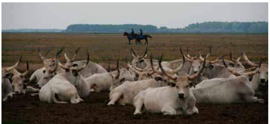
Frå Ungarn.

dømes nye forretningsområde. Prosjektet, med namnet «Transfarm», er eit samarbeid mellom institusjonar i Hellas, Italia, Spania, Belgia, Tyskland, Slovakia og Noreg. Leiinga av prosjektet ligg til NMBU i Noreg.