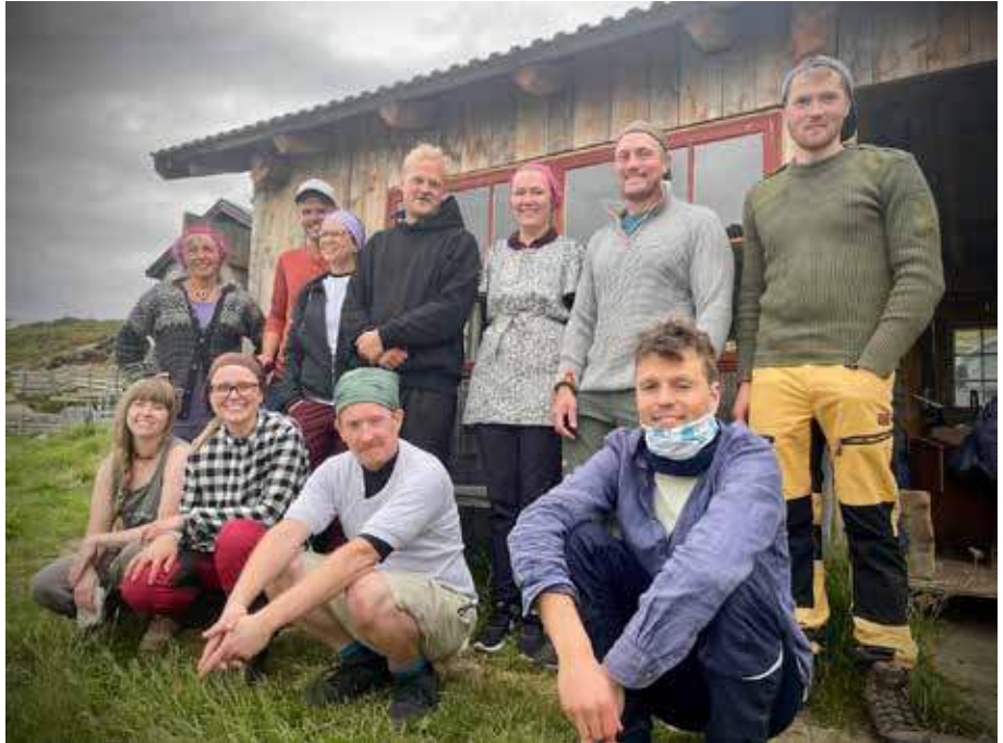
Her er hele gruppa på stølskurset.

bort på en slik helg er hvordan man tar vare på naturen ved å benytte alle dens ressurser på en bærekraftig måte.