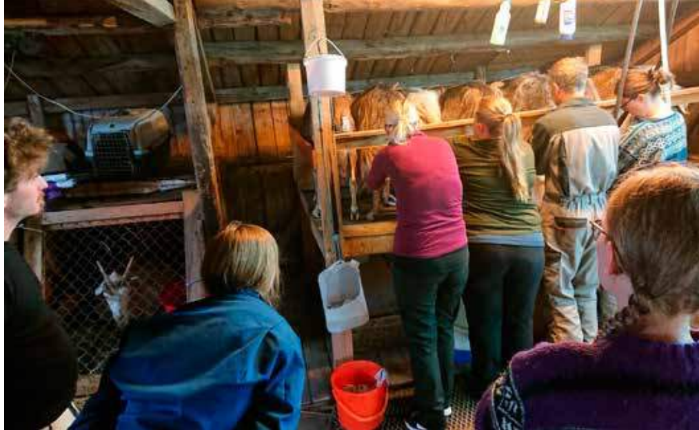
Kursgruppa i geitefjøset.

forteller om krabbing på alle fire og vill begeistring når enkelte truede arter ble gjenkjent.