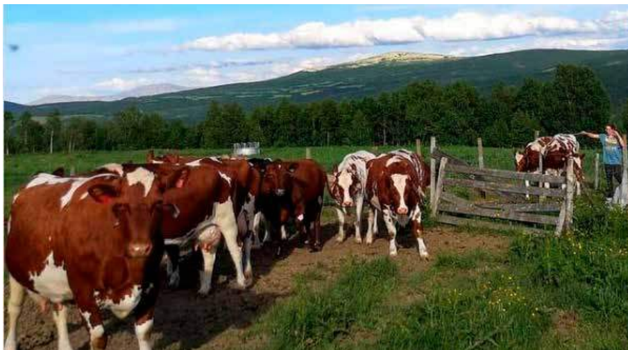
Illustrasjonsbilde fra Langsetra, av Marit Lind Jordet.

Jordbruket klarte å forhandle seg fram til at det blir to minimumssatser; kr 50 000 ved minst 4 ukers seterdrift og kr 70 000 ved minst 6 ukers seterdrift. Dette var i samsvar med jordbrukets krav, men Staten tilbød i første omgang kun en utredning av framtida for seterdrifta. Staten ville beholde gjeldende minimumssats på kr 50 000 ved seks ukers drift. Jordbruket krevde også et nasjonalt foredlingstilskudd på kr 10 000 per seter, kr 10 000 ekstra per deltaker i felleseter, og at det innføres et nasjonalt tilskudd til besøksseter etter mal av det de har i Trøndelag. Disse kravene ble ikke innfridd, men det blir en utredning for seterdrifta før neste års forhandlinger. Det er veldig gledelig at det ble enighet om å øke minimumssatsen for over 6 ukers seterdrift til kr 70 000. Setertilskudd går over Regionalt Miljøprogram, slik at det er opp til det enkelte fylke å fastsette satser, på eller over minimumssatsen. Det som er ekstra gledelig er at de fleste fylker ser ut til å ha lagt seg en god del over minimumssatsene. Men det er