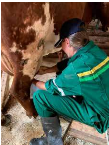
Det er handmjølkning på Gardsetra.

Ideen om at vi skulle starte opp med setring kom tørkesommeren 2018. Det året fikk DNV mange forespørsler fra lokale bønder om bruk og innhøsting av alternative førkilder som slått av utmarksområder, styving av trær og bruk av lauv til fôr. Det viste oss hvor mye kunnskap om