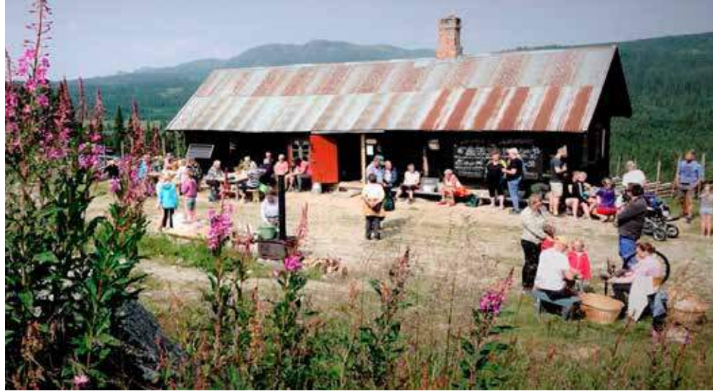
Seterfestival på Gardsetra i 2021.