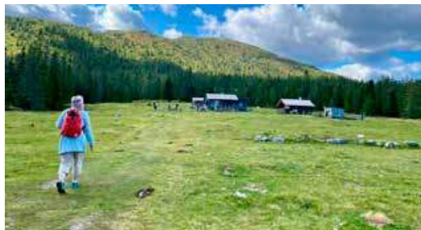
Frå Gavlesjåstulen sommaren 2021.