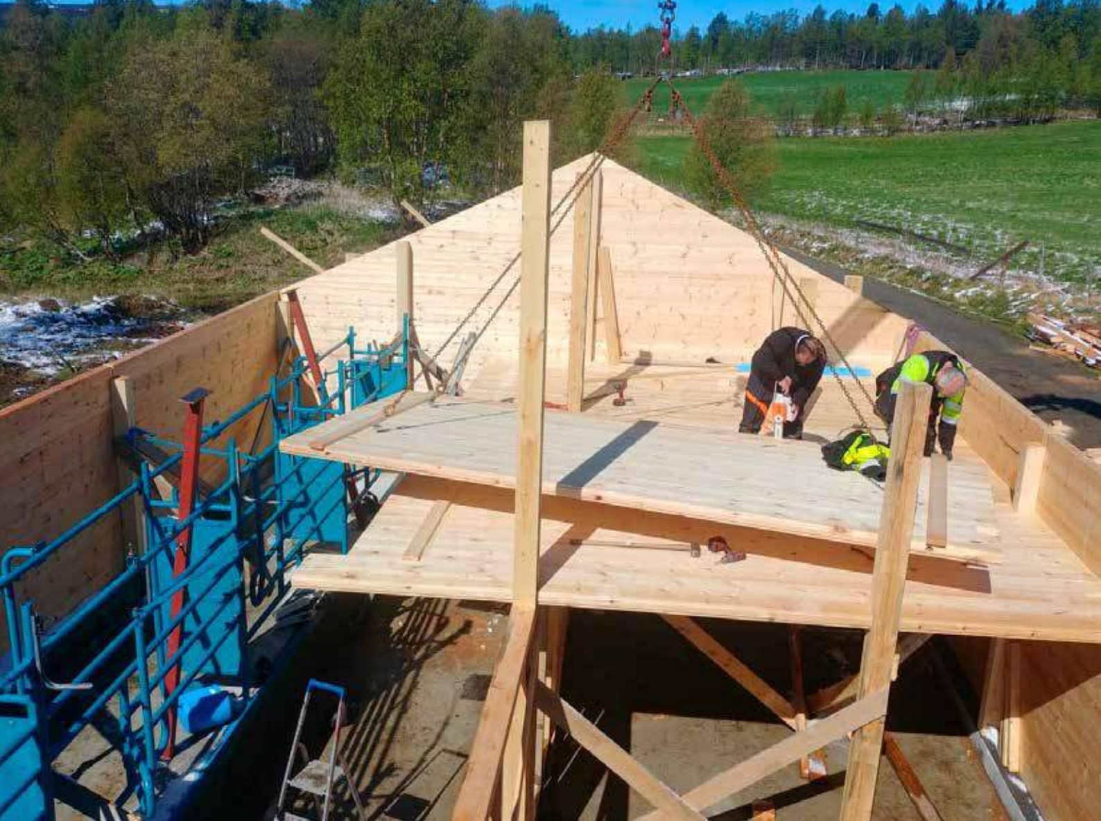
Sommaren 2020 skal etter planen det nye seterfjøset stå ferdig.