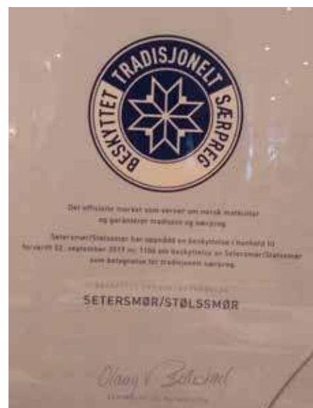
Diplomet som syner tildelinga av verna status til setersmør og stølssmør var utstilt på landsmøtet.