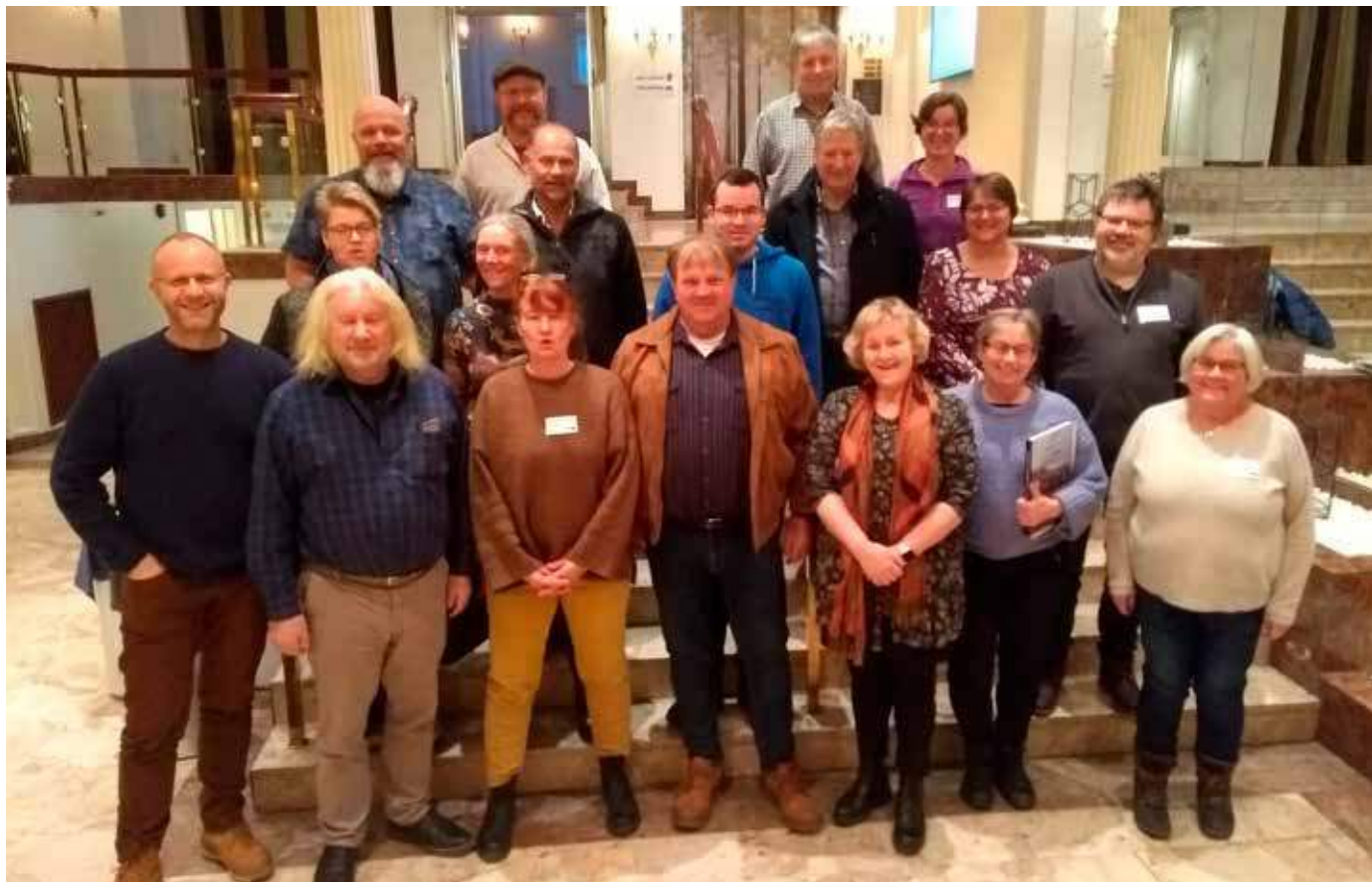
Desse var med på Norsk seterkultur sitt årsmøte på Lillehammer 16. februar 2020.

På denne og dei neste sidene kjem stoff frå fagsamlinga og årsmøtet til Norsk seterkultur på Lillehammer 15. - 16. februar 2020.