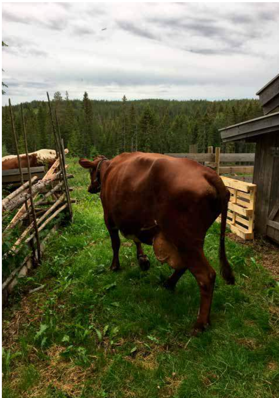
Ei ku på veg ut på vangen på Skålbergsetra (foto: Knut Ola B. Storbråten).

Det elektroniske skjemaet inneholder disse spørsmålene: