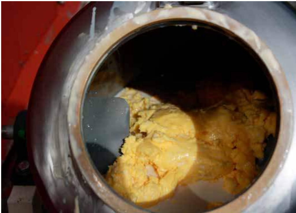
Kinning av setersmør.

Norsk seterkultur oppnådde høsten 2019 «beskytta betegnelse» for setersmør på tradisjonelt grunnlag. Sommeren 2020 vil bli et testår for ordningen.