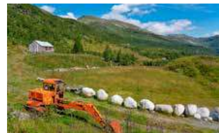
Frå Olavstøl i Granvin.

havet, i retning Mjølfjell og Finse frå Granvin. Er du interessert i beite kan du ringja 90705810.